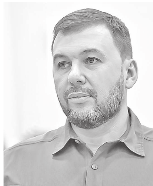
Денис Пушилин, Глава Донецкой Народной Республики

Если бы не тот единый порыв, который мы противопоставили киевскому произволу, Донбасс ничего хорошего бы не ждало. Но, к счастью, это тот самый случай,