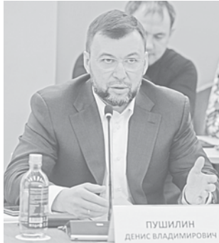
ПУШИЛИН ДЕНИС ВЛАДИМИРОВИЧ

Донбасс всегда был знаменит как угольный край. Сегодня ДНР с полным правом претендует на значительную долю в промышленности России по запасам и добыче этого вида топлива. Это подтверждает доклад, с которым выступил Глава ДНР Денис Пушилин на недавнем заседании комиссии Госсовета РФ по направлению «Энергетика».