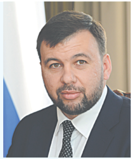
Денис Пушилин, Глава Донецкой Народной Республики

От имени жителей Донецкой Народной Республики и от себя лично выражаю вам огромную признательность за ваш самоотверженный труд и неравнодушное деятельное участие в общественных процессах в Республике, в которых вы также на высоте. Желаю вам непрерывного совершенствования профессионального мастерства, добрых и открытых отношений с вашими воспитанниками и, конечно же, мира, здоровья и благополучия!