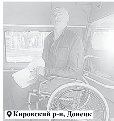
Кировский р-н, Донецк

низовали за один день! Партия – настоящий помощник жителей ДНР, заслуживший уважение в народе.