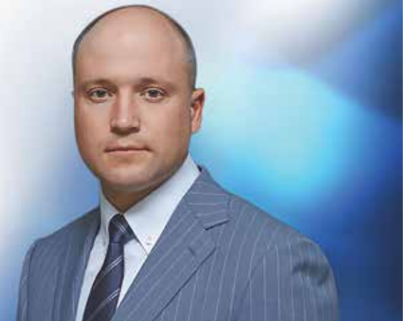
Владимир Тужилин Министр транспорта ДНР

Жители Республики были приятно удивлены, что министр транспорта лично выезжает на места и проверяет, к примеру, состояние салонов автобусов, как было в случае обращения по поводу грязи в салоне автобуса, курсирующего между Донецком и Макеевкой, и замечает, что остановки на межрегиональном маршруте Донецк – Луганск не только без названий, но еще и похожи – попробуй отличи! С этой проблемой министр тоже обещал разобраться. В общем, вселил уверенность в том, что все вопросы будут решены, учтены и урегулированы.