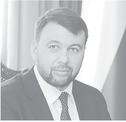
Денис Пушилин врио Главы Донецкой Народной Республики