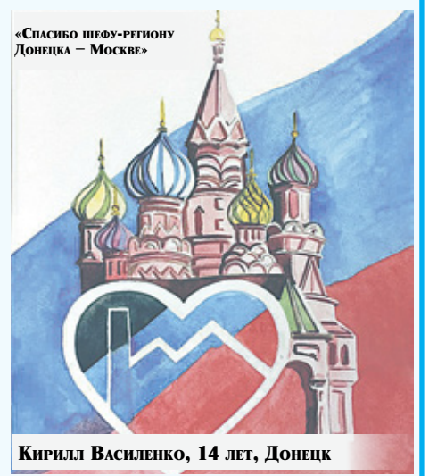
«СПАСИБО ШЕФУ-РЕГИОНУ Донецка – Москве»