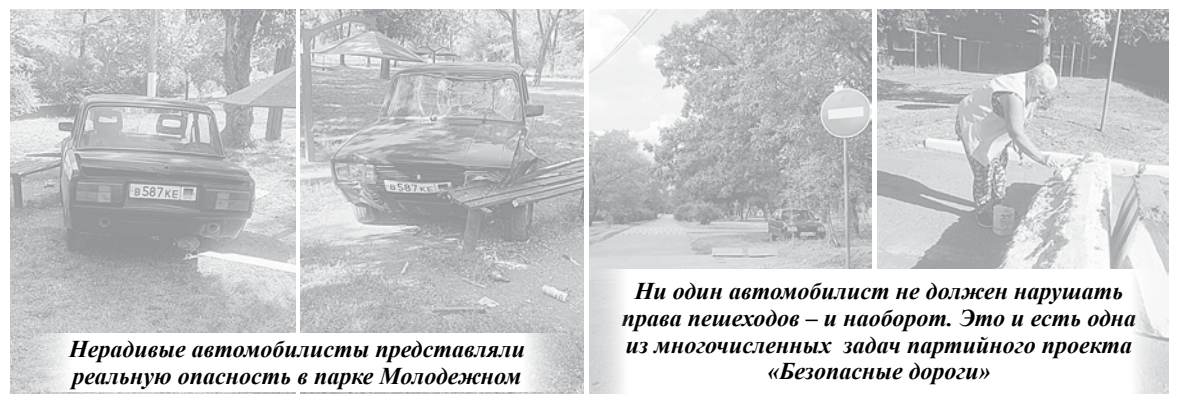
Нерадивые автомобилисты представляли реальную опасность в парке Молодежном

Отдельная благодарность главе города Моспино и начальнику ГИБДД Донецка за проявленное неравнодушие. Это настоящая командная работа, которая привела к достойному результату.