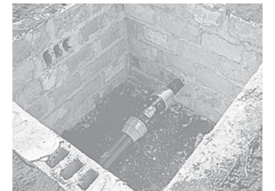
Новый источник чистой воды в селе Привольное

И действительно, эти люди не просто любят свою землю, но разминируют и засаживают ее, они заботятся о сельчанах и пекут хлеб военнослужащим, которые их защищают. Вот такое оно, наше российское село.