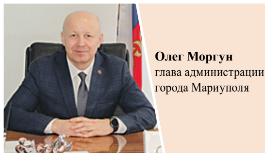
Олег Моргун глава администрации города Мариуполя

“ Мариуполь по праву считается крупнейшей стройкой России. Капитально ремонтируются не только объекты критической инфраструктуры, но и строятся новые детские дошкольные и школьные учреждения, больницы, развивается культурная и спортивная инфраструктура города.