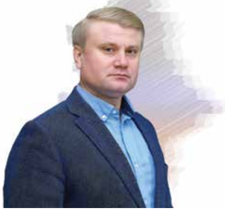
Артем Крамаренко и. о. заместителя Председателя Правительства ДНР – министр агропромышленной политики и продовольствия ДНР

ДНР обладает серьезным сельскохозяйственным потенциалом даже с учетом ущерба от разрушений, принесенных военными действиями. Нашим достижением стала полная обеспеченность Республики зерном. В 2022 году были освобождены территории и площадь посевов увеличилась на 144 тыс. гектаров (на 55%).