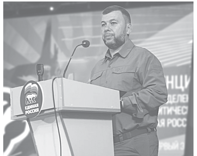
Денис Пушилин врио Главы ДНР, руководитель Донецкого регионального отделения «Единой России»