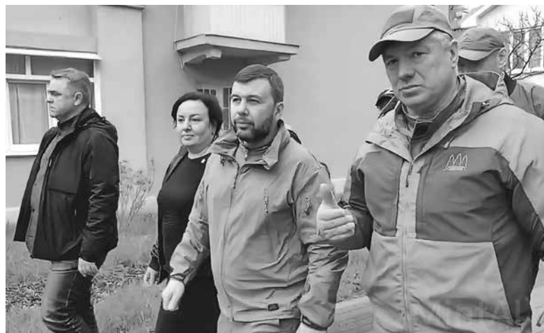
Денис Пушилин и Марат Хуснуллин посетили объект

«Все дороги не получится сделать. Важно, чтобы те, которые востребованы, были отремонтированы.