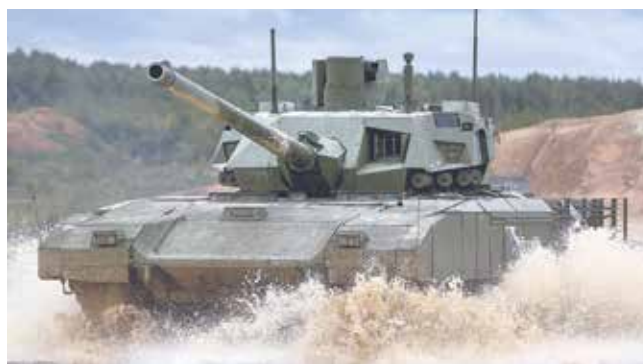
Российский танк Т-14 «Армата»

Бронкапсула для трех танкистов находится за массивной лобовой броней и отделена от боеукладки снарядов, обеспечивая улучшенную защиту экипажа. Также в состав вооружения входят спаренный с пушкой пулемет винтовочного