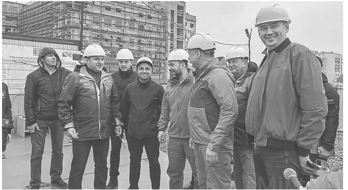
Денис Пушилин и Марат Хуснуллин проинспектировали строительство медцентра

«Мы видим, какими темпами сейчас строится перинатальный центр. То, что это будет востребовано в