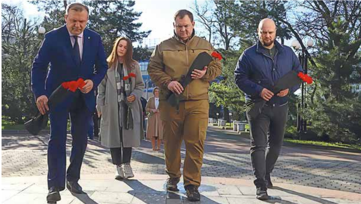
Активисты «Единой России» почтили память ликвидаторов аварии на ЧАЭС

Напомним, что 26 апреля 1986 года в 01 час 23 минуты 40 секунд по