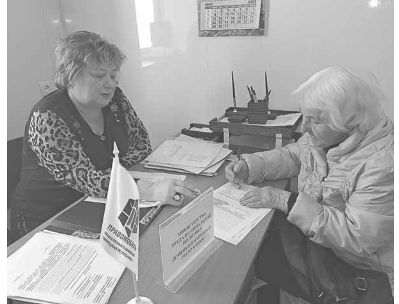
Юрист проводит консультацию на выезде