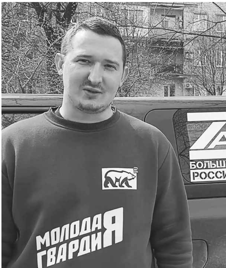
Активист отправляется на помощь маломобильным

Ситуация усугубляется, по словам Ильи, тем, что фактически