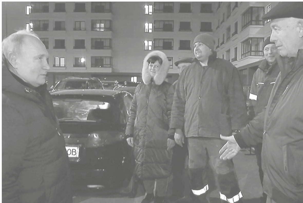
Владимир Путин общается с жильцами микрорайона Невский

Показывая Владимиру Путину новые кварталы, вице-премьер ак-