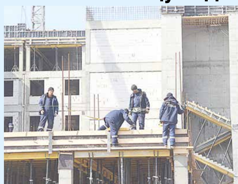
Строительство центра идет ударными темпами

«Россия создает условия для поощрения и охраны материнства, Донбасс это сразу ощутил – и по выплатам маткапитала, и по строительству перинатального центра. Уверен, это позитивно скажется на повышении рождаемости», – резюмировал врио Главы ДНР Денис Пушилин.