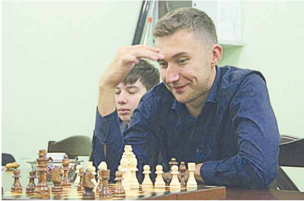
Сеанс одновременной игры Сергея Карякина с юными шахматистами Донецка