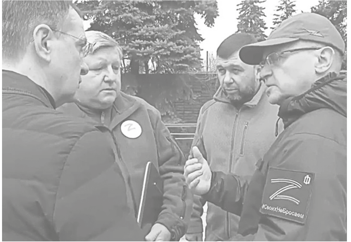
Обсуждение реконструкции мемориала шахты № 4/4-бис

«Масштабы произошедшей здесь трагедии столь велики, что этот мемориал должен стать местом особого почитания памяти погибших. Важно, чтобы наши дети и внуки не забывали о преступлениях фашизма. Наша миссия – искоренить неонацизм, с которым мы тоже столкнулись, чтобы не передавать проблему будущим по-