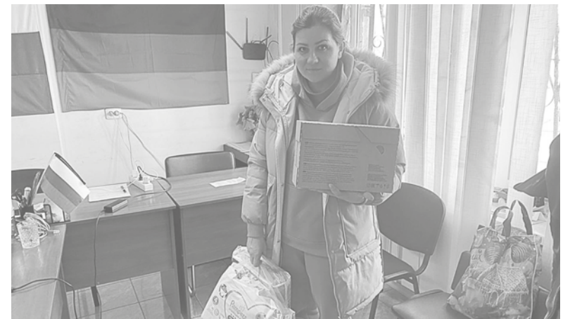
Гумпомощь для мариупольцев

«Мы пережили тяжелые времена, но сейчас есть надежда на мирное будущее, чтобы наши дети могли спокойно жить в большой единой стране – России. Я помогала своей матери восстанавливать дом, в котором украинские боевики во время боев за город устроили огневую точку. Часть дома превратилась в