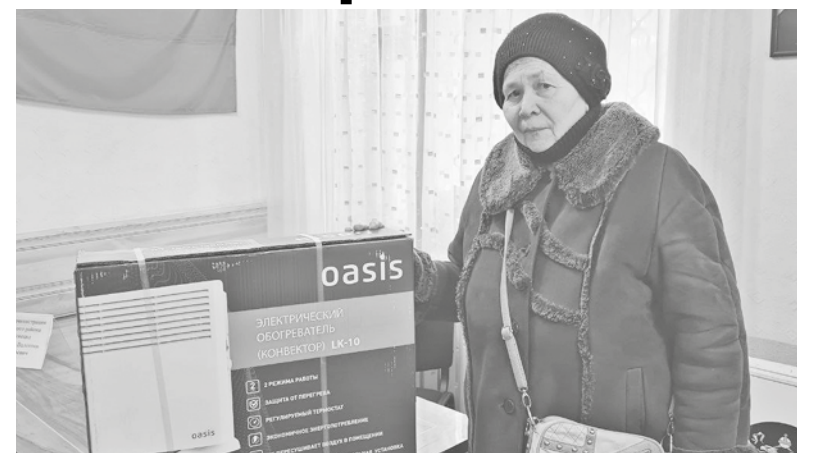
Обогреватель для жительницы Киевского района Донецка

Во вторник 13 декабря, активисты доставили помощь в прифронтовые районы Донецка и Горловки. В Ворошиловский район Донецка общественники привезли пять упаковок средств личной гигиены,