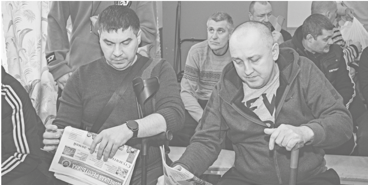
Бойцам привезли свежий номер «Донецкой Республики»

«На фронт пришел по мобилизации еще в феврале. Нас с шахты «Комсомолец Донбасса» призвали несколько сотен человек. Служу в стрелковом полку. В основном нес службу на блокпостах, в очередное дежурство прилетел беспилотник, сбросил ВОГ. Немного поседел осколками. Врачи говорят – жить буду. Подлечусь – и обратно на фронт», – рассказывает рядовой