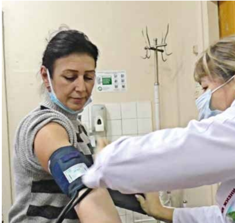
Активистка ОД «ДР» сдает кровь