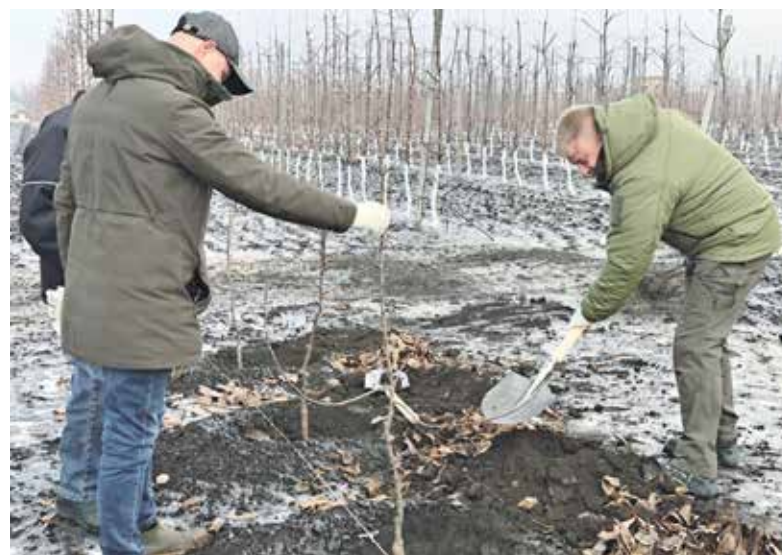
Высадка саженцев из Ставрополя

На территории предприятия «Экопрод» в Волновахе заложили яблоневый сад. Саженцы были переданы аграриям из Ставропольского края.