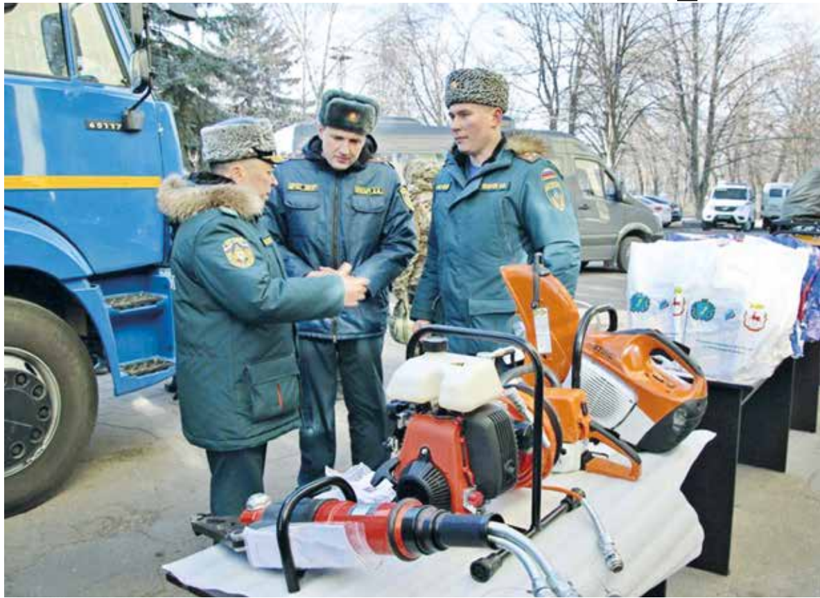
Спецтехника для спасательного отряда Харцызска

Не остались без внимания и дети сотрудников МЧС – для них под-