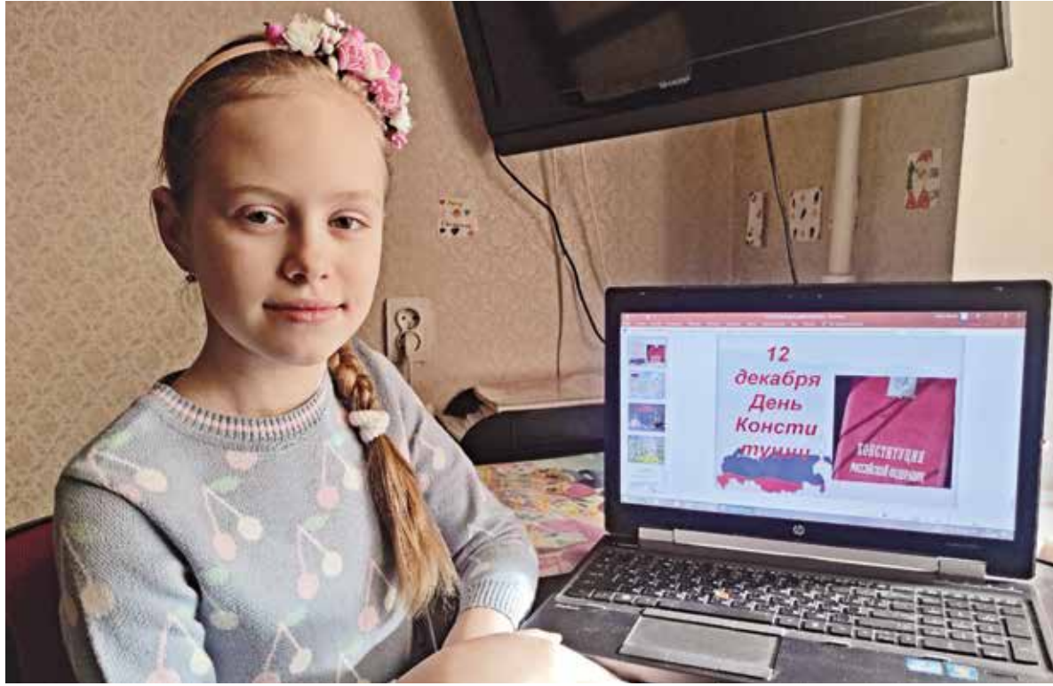
Онлайн-урок в Ленинском районе Донецка

Сотрудники филиала-библиотеки № 5 Горловки провели виртуальный час гражданственности «За-