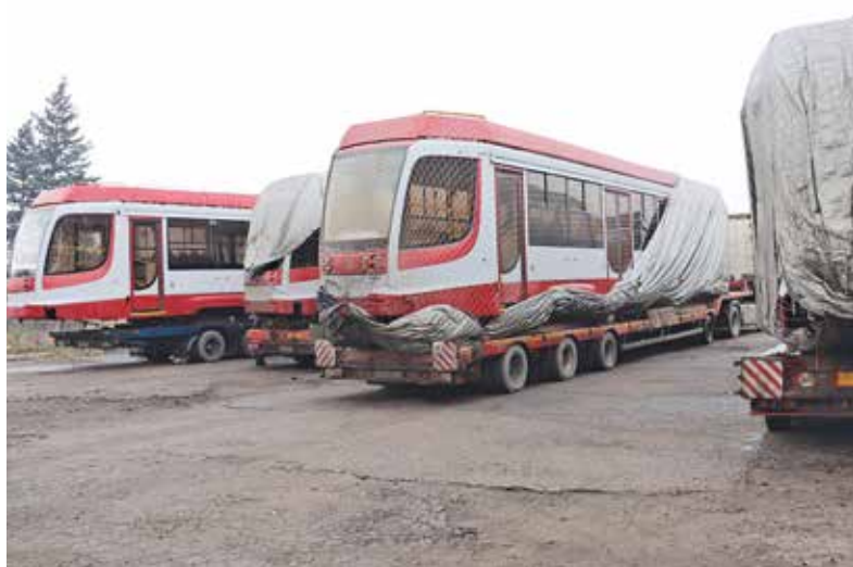
Новые трамваи приехали в Енакиево

Первая партия трамваев от региона-шефа поступила в город в конце августа, в сентябре они уже начали курсировать на городских маршрутах. Из петербургского резерва было выделено шесть трамвайных вагонов. Машины оснащены всем необходимым для комфортных перевозок: в салоне мягкие сиденья, места для инвалидов, электронные указатели маршрута и разъемы USB для подзарядки гаджетов.