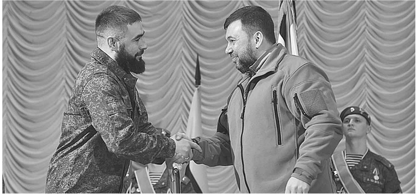
Денис Пушилин поздравляет бойца

Орденом Республики за массовый героизм врио Главы ДНР Денис Пушилин в воскресенье, 11 декабря, награждает 100-ю отдельную мотострелковую бригаду и вручил государственные награды лично в составе.