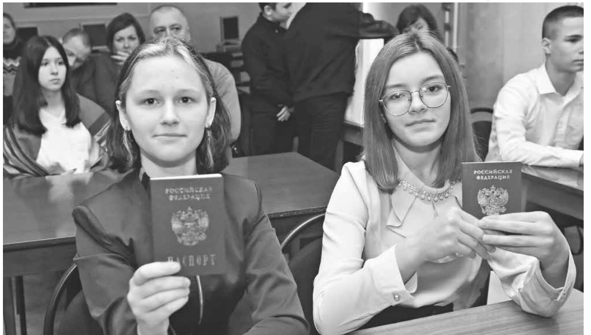
Юные граждане Российской Федерации

«Да, нам предстоит еще пройти определенные непростые этапы, но уже после окончания войны – только про созидание, про строительство. Про строительство и обустройство нашей