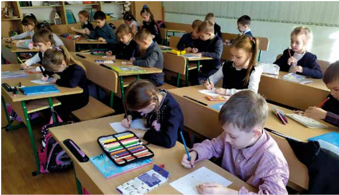
Школьники приступили к занятиям в обновленных классах

Специалисты восстанавливают Центральную больницу Тельманово – сейчас идет ремонт в акушерско-гинекологическом отделении. До конца декабря текущего года в медучреждении планируется на-