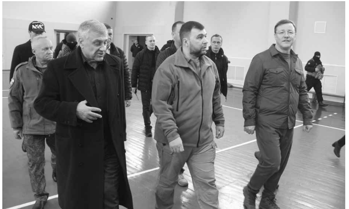
В отремонтированном спортзале детско-юношеской школы

Снежнянский музей боевой славы с 1968 года расположен на 1-м этаже жилого дома и за все это время его отопительная система ни разу не ремонти-