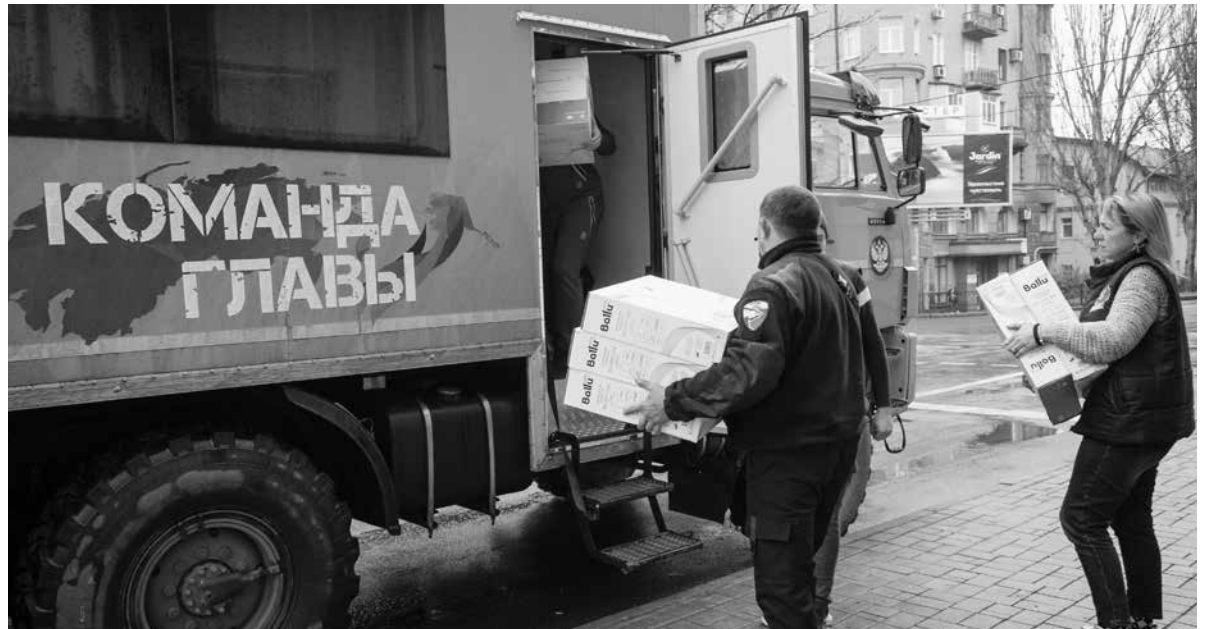
Активисты грузят обогреватели для освобожденных территорий

С наступлением холодов работа по обеспечению жителей Республики теплом является одним из важных направлений представителей Штаба по работе с прифронтовыми районами Общественного Движения «Донецкая Республика». Активисты доставили большую партию обогревателей гражданам, проживающим на освобожденных территориях ДНР, в которую вошли 355 конвекторов и 245 инфракрасных обогревателей.