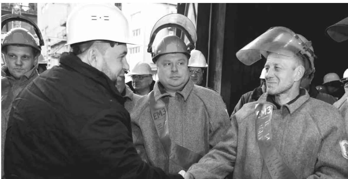
Денис Пушилин поздравил ветеранов завода

Приветствуя участников мероприятия, Денис Пушилин подчеркнул, что самым важным достоянием завода «во все времена, конечно же, были люди». По его словам, за более чем столетнюю историю енакиевский завод прошел через множество испытаний, но коллектив со всем справился. Он напомнил, что в годы Великой Отечественной войны предприятие было вывезено на Урал, но после полного освобождения города уже через 100 дней на заводе состоялась первая плавка. «Конечно же, и непростые 90-е годы, которые пережива-