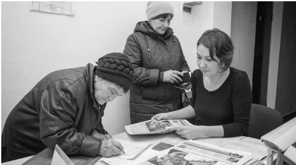
Жители Дмитровки регистрируются на прием специалистов

Еще одна проблема сельчан – недобросовестные арендаторы земельных паев. Практически все жители местных сел имеют земельные паи – люди получили их после распада колхозов. Некоторые землю продали, некоторые сдают в аренду. «Я заключила договор аренды с предпринимателем, но он не отдал мне мой экземпляр документа. Потом он пропал и выплаты за текущий год не сделал. В результате недавно я получила квитанции на оплату земельного налога, а пла-