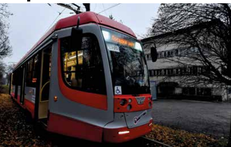
Ленинградский трамвай на маршруте города

«Задача стоит серьезная, но она выполнимая. Такой опыт уже был у нас с Симферопольским районом Крыма. В ближайшие два-три года мы будем активно помогать Енакиево в восстановлении и внедрении российских стандартов на коммунальных и социальных объектах. Енакиево – это 19-й муниципальный район Ленинградской области и наравне с нашими муниципалитетами будет получать и помощь, и поддержку по нашим адресным программам», – подчеркнул Александр Дрозденко.