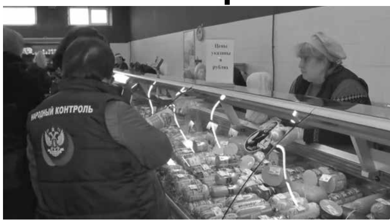
Народные контролеры в одном из магазинов

Порадовал проверяющих магазин «Лукошко» по улице Краснодонцев – там недочеты не выяв-