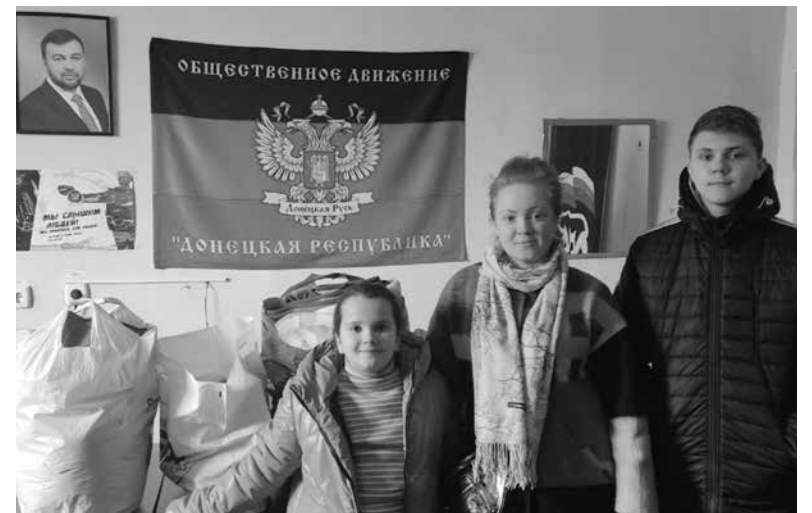
Гумпомощь для беженцев из Артемовска