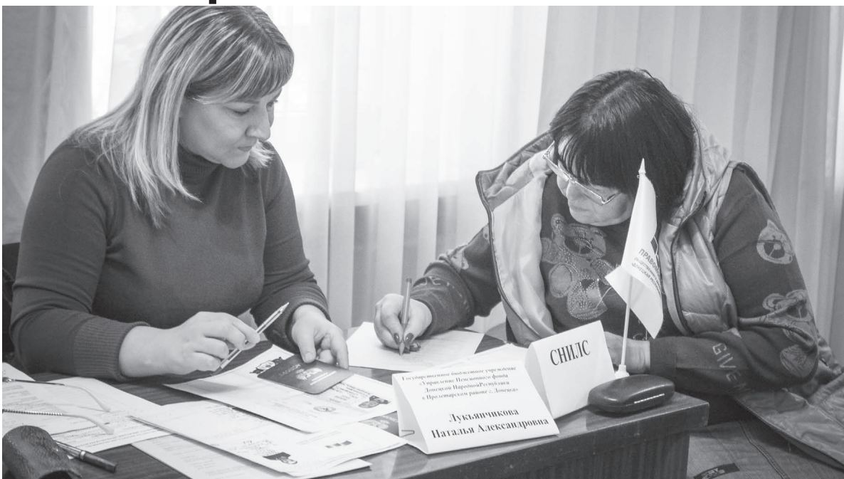
Консультация по оформлению российской пенсии

«Я одна воспитываю ребенка и, к сожалению, денег не хватает несмотря на то, что работаю на двух работах. Мне подсказали, что