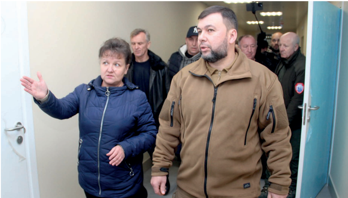
Лидеру Республики показывают отремонтированный корпус больницы

К ремонтным работам подрядная организация приступила 17 июня, задача – сдать объект к концу те-