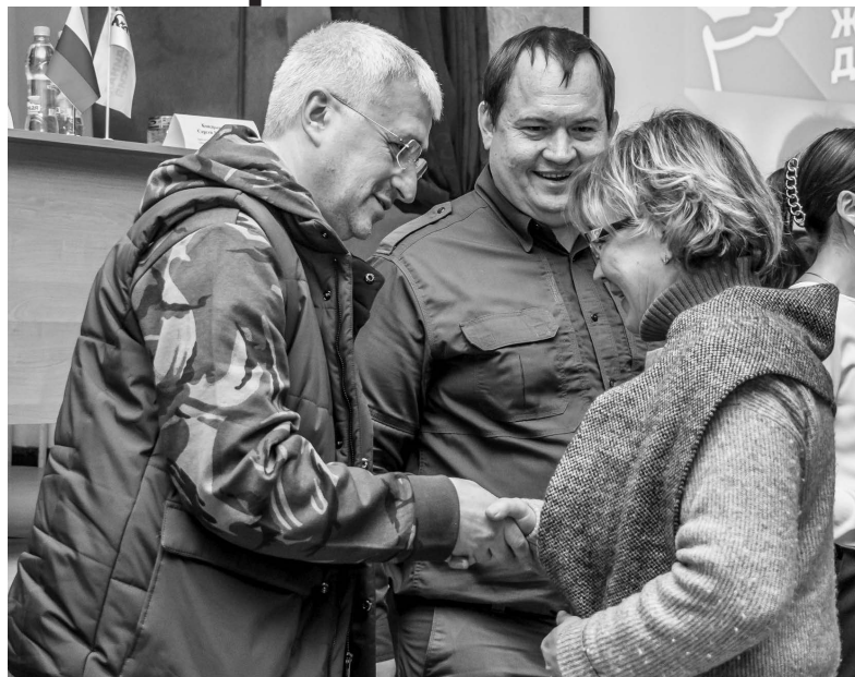
Поздравление со вступлением в партию

Депутат Государственной Думы РФ Зураб Макиев выразил уверенность, что единороссы Донбасса успешно интегрируются в партийную структуру, что позволит расширить возможности для решения вопросов, поставленных людьми перед властью. «Единая Россия – это ответственная партия, которая все эти восемь лет помогала Донбассу. С первых дней СВО мы органи-