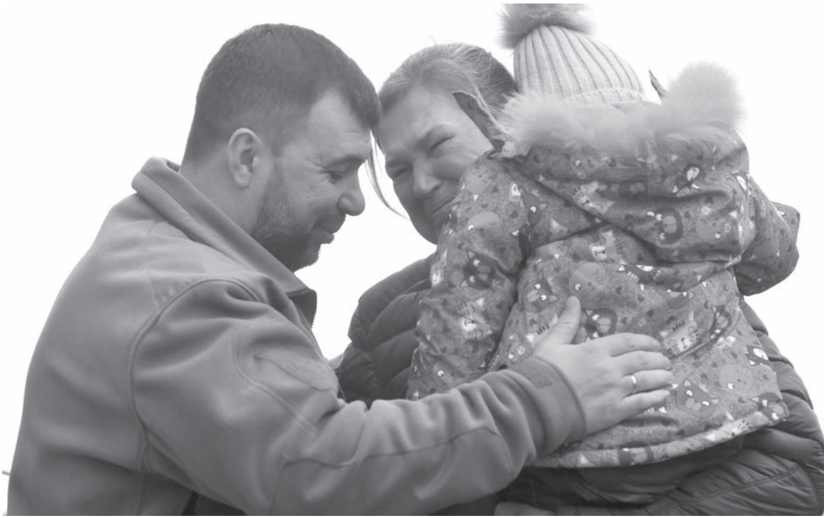
Ключи от долгожданной квартиры вручил лично Денис Пушилин