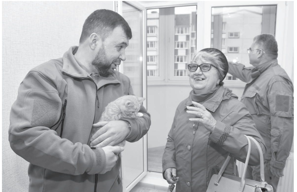
Денис Пушилин со счастливыми новоселами в Мариуполе

Глава государства отметил, в «Сириусе» открылась программа по дополнительной подготовке учителей из Донбасса, Херсонской и