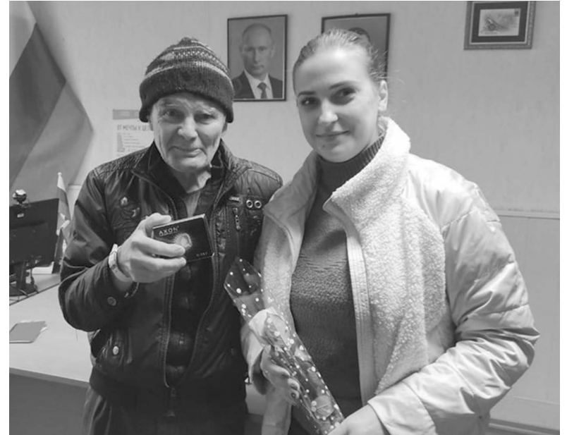
Новый слуховой аппарат пенсионеру из Снежного