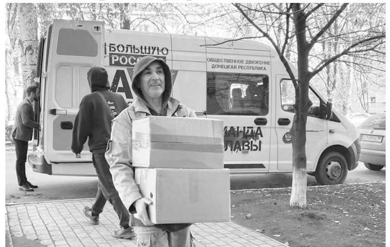
Активисты привезли гумпомощь в ПВР Енакиево

В пункт временного размещения беженцев из Мариуполя и Волновахи, расположенном в Енакиеве, активистами ОД «ДР» было доставлено более 1000 единиц теплых вещей и более 200 единиц игрушек.