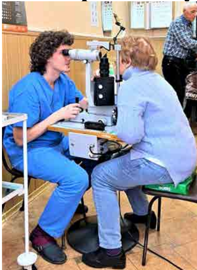
Прием офтальмолога в больнице Кировского