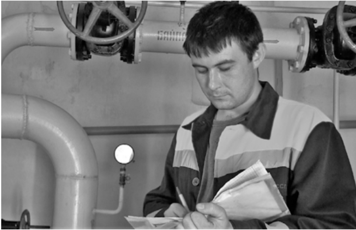
Специалист контролирует работу котельной

Он назвал работу энергетиков колоссальной, особенно в условиях разминирования территорий: «Приходилось очень много территорий после ведения боевых действий освобождать от мин». «Серьезная работа газовщиками про-