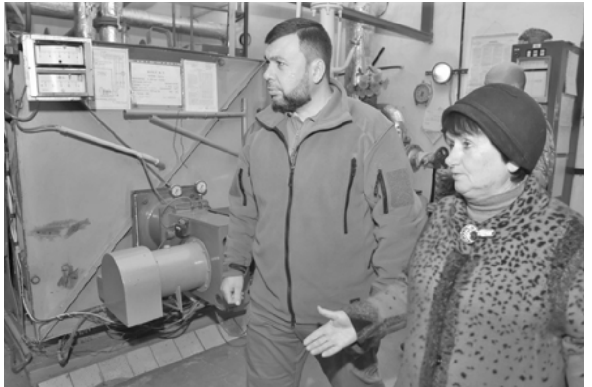
Денис Пушилин проверил работу котельных

В этот же день Денис Пушилин посетил котельную квартала 243 Ворошиловского района Донецка, которая 31 октября подверглась обстрелу.