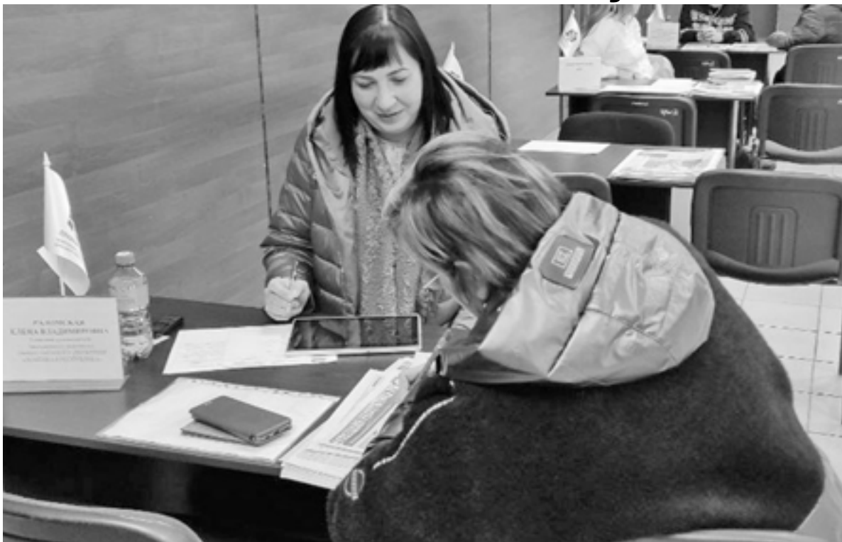
Местная жительница обратилась с вопросом о наследстве

Жителей города очень волнует отопительный сезон. «Я пришла по вопросу получения компенсации за уголь для своей соседки, которая прикована к постели. Специалист мне все доходчиво разъяснил, завтра начну собирать до-