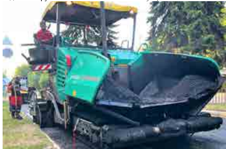
Укладка асфальта на улицах Зугрэса

Отметим, что Нижегородская область выслала две коммунальные бригады, чтобы подстраховать местных специалистов в отопительный период и в случае возникновения аварийных ситуаций.