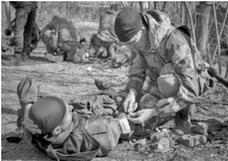
Идет занятие по тактической медицине