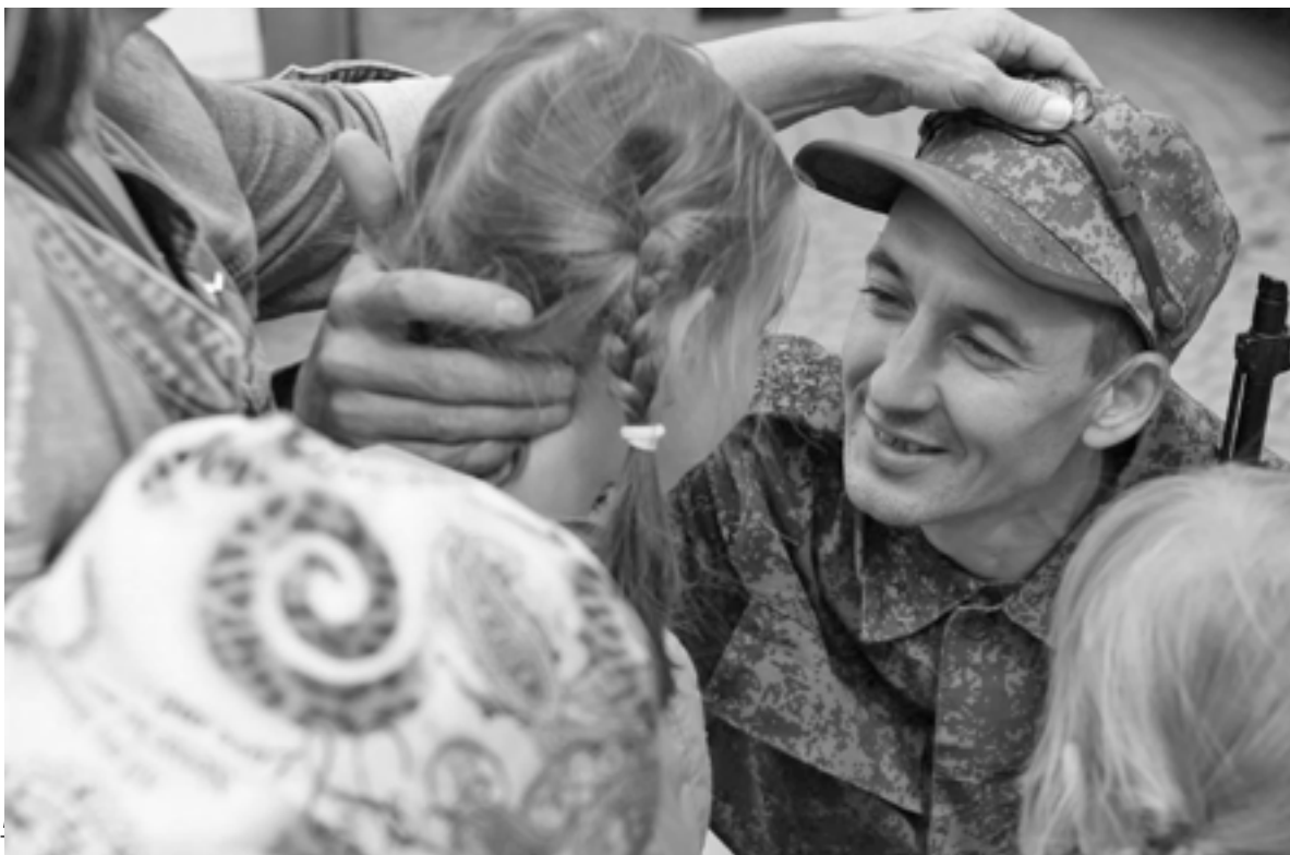
Льготы предусмотрены всем бойцам и их семьям

«Сразу же встал вопрос о мерах социальной поддержки семей мобилизованных. За работниками, призванными для прохождения военной службы по моби-