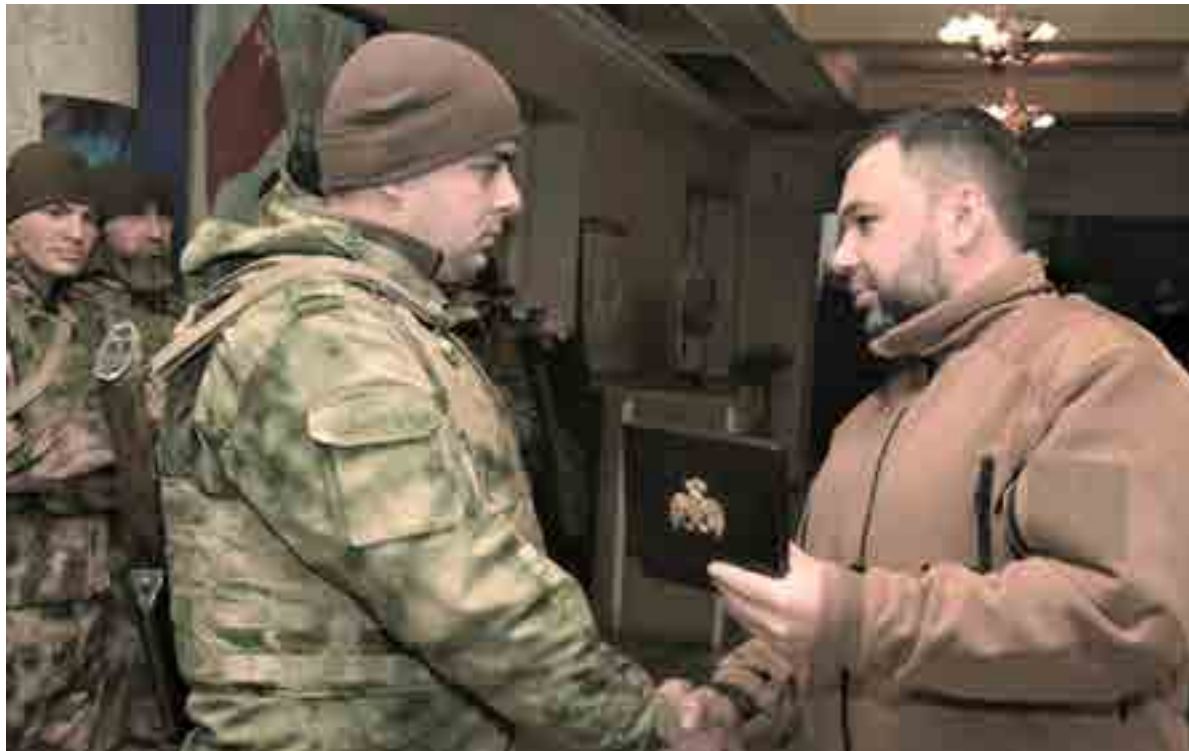
Денис Пушилин вручает заслуженную награду бойцу

За заслуги перед Республикой и ее народом, связанные с совершением героического подвига,