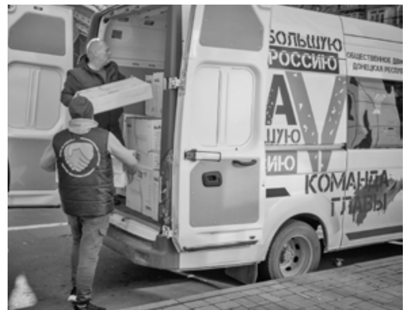
Активисты разгружают машину с обогревателями

В Шахтерск было направлено 225 обогревателей, для жителей освобожденных поселков Зайцево, Веселая Долина, Отрадовка, Иванград, Опытное и других населенных пунктов, которые сейчас адми-