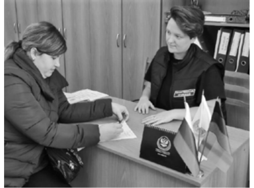
В ОП Куйбышевского района Донецка