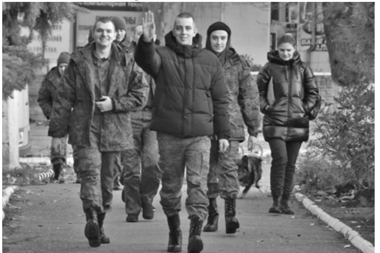
Освобожденные бойцы ждут встречи с родственниками

Бойцы рассказали, как проходили их дни в плену, где и в каких условиях они содержались. «В плену к нам обращались как к нелюдям. Я не могу передать словами отношение, которое к нам было. Постоянные издевательства, оскорбления. Каждый день. Когда нас взяли в плен – это был март месяц, мороз, нас раздели полностью, погрузили в пикап открытый и повезли. Са-