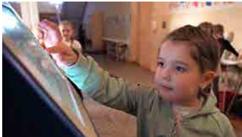
Школа № 2 – по российским стандартам

Всего за три месяца в Мангуше при содействии специалистов из Курской области восстановлена школа № 2. Теперь учебное заведение соответствует современным нормам и стандартам РФ.