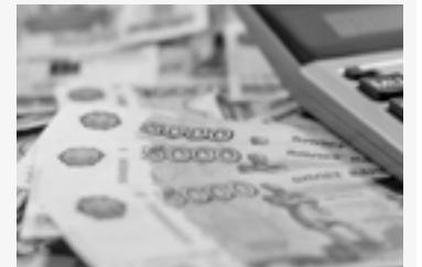
Российский МРОТ в Республике

В МВД сослались на пункт 12 статьи 25 Федерального закона от 10 декабря 1995 г. № 196-ФЗ «О безопасности дорожного движения», согласно которому постоянно или временно проживающие либо временно пребывающие в России граждане допускаются к управлению транспортными средствами на основании российских национальных водительских удостоверений, а при отсутствии таковых – на основании национальных или международных водительских прав.