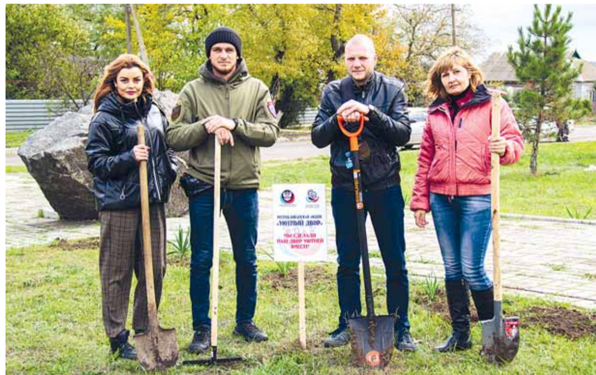
Активисты Мангуша привели в порядок один из скверов