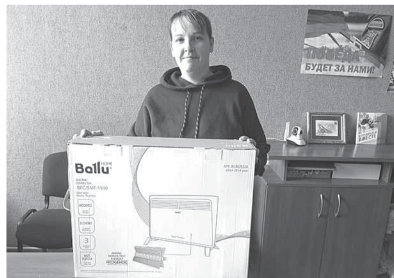
Теперь в квартире будет тепло

Без внимания не оставили и просьбы о помощи от жителей Докучаевска. По их запросу привезли 17 упаковок гигиенических принадлежностей для взрослых. Также семьям мобилизован-