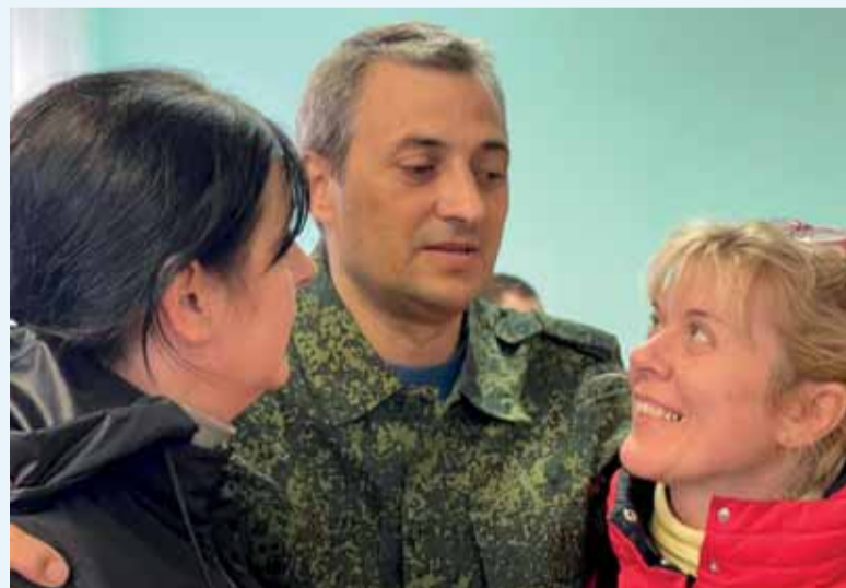
Встреча с родными после плена

«К сожалению, наших ребят меньше попало в список, чем изначально мы подавали. Переговоры действительно очень сложные. Потому что Украина не интересуется своими бойцами. Да, если это «Азов» либо какие-то командиры – переговоры ведутся, а обычные ребята-военнослужащие, Украиной призванные, мо-