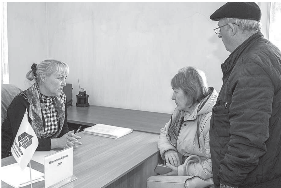
На приеме у специалиста Пенсионного фонда ДНР