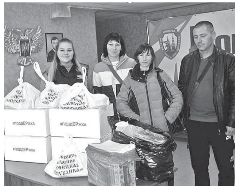
Гумпомощь для переселенцев из Харьковской области

В Торезе активисты привезли канцелярские принадлежно-