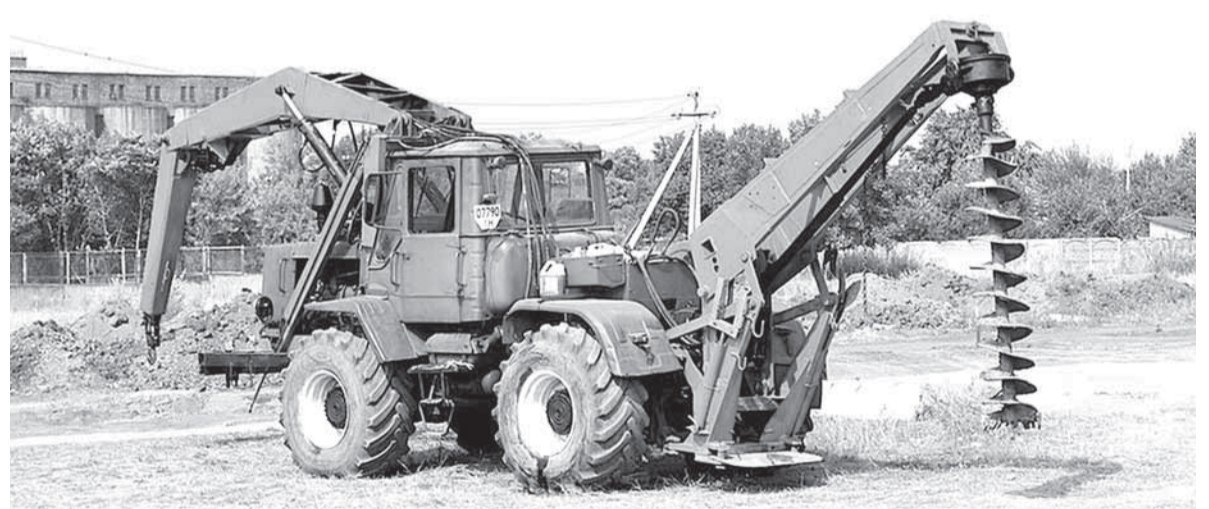
Буровая техника готова к работе

Он сообщил, что когда начинается водозабор жителями из системы отопления, то ежедневная подпитка начинает составлять