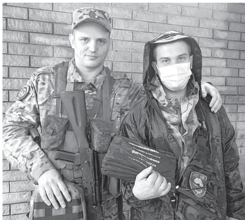
Бойцы 107-го СБ

«Даже не сомневался, когда приехал сюда восемь лет назад. Мы единый народ и должны быть опять вместе в одной большой и сильной стране – России. Уверен, что наши мечты скоро сбун-