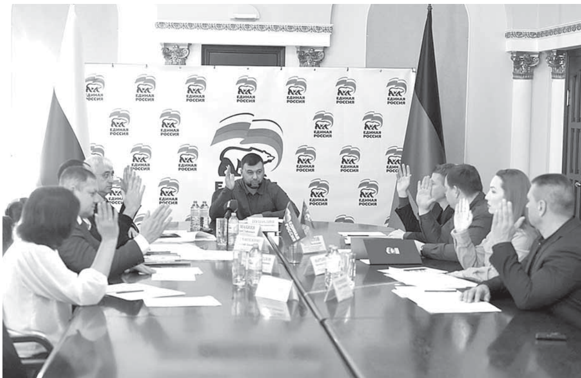
За проведение общего собрания проголосовали единогласно

«Люди поверили «Единой России», и мы должны сделать все,