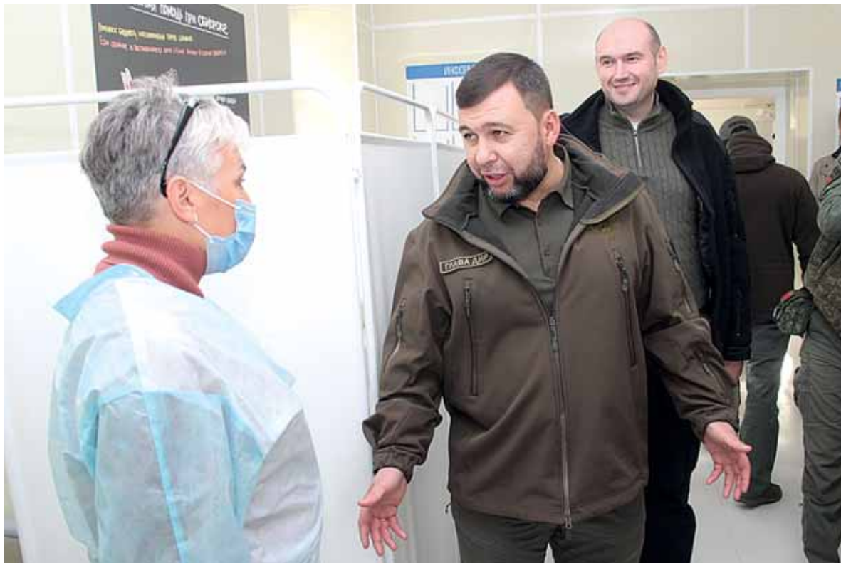
Денис Пушилин пообщался с персоналом восстановленной больницы

Денису Пушилину показали уже полностью отремонтированный корпус диагностического и стоматологического отделений, где временно принимают пациентов разные специалисты. Корпус капитально отремонтирован, оснащен необходимой мебелью, техникой и медицинским оборудованием. Подведены новые коммуникации, на территории учреждения пробурены две скважины для обеспечения водой. В больнице работают 118 человек, однако есть острая нехватка профильных