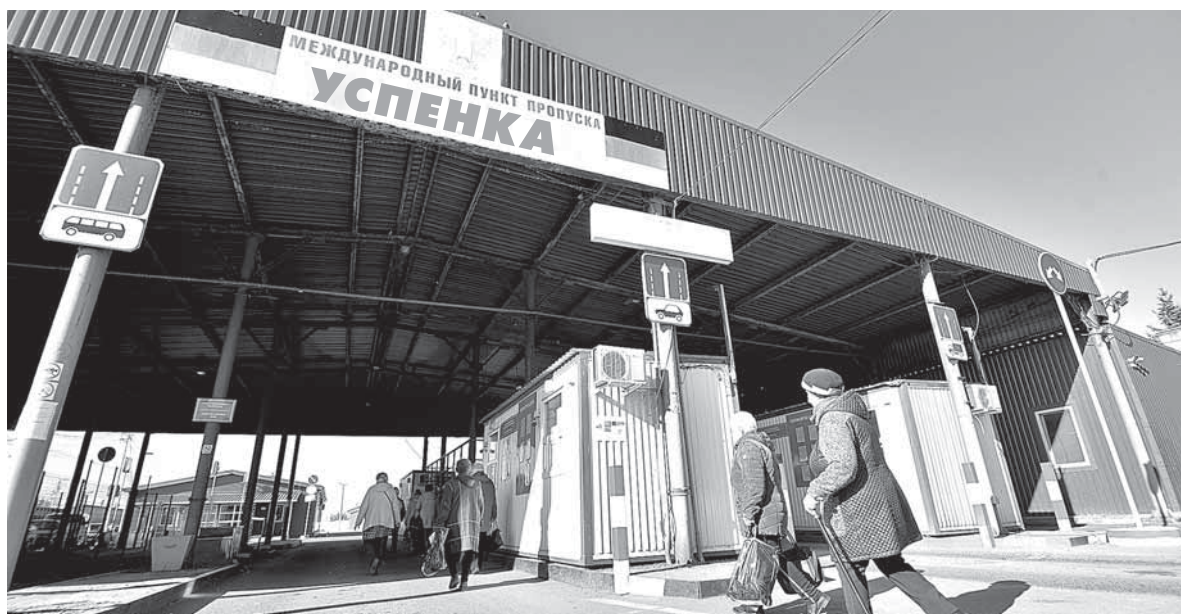
На КПП «Успенка» снят пограничный контроль

В паспорта гражданина Российской Федерации, которые выдаются после 4 октября, будет сразу ставиться штамп о месте реги-