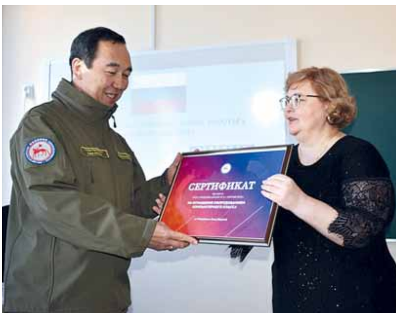
Компьютерный класс – в подарок