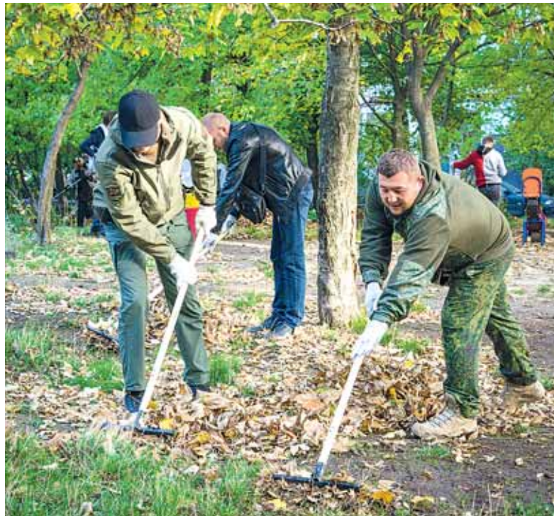
Активисты ОД «ДР» за работой

«Мы сейчас занимаемся дистанционно, поэтому всегда можно найти время для общественно полезной работы, тем более что живу я недалеко. На следующей