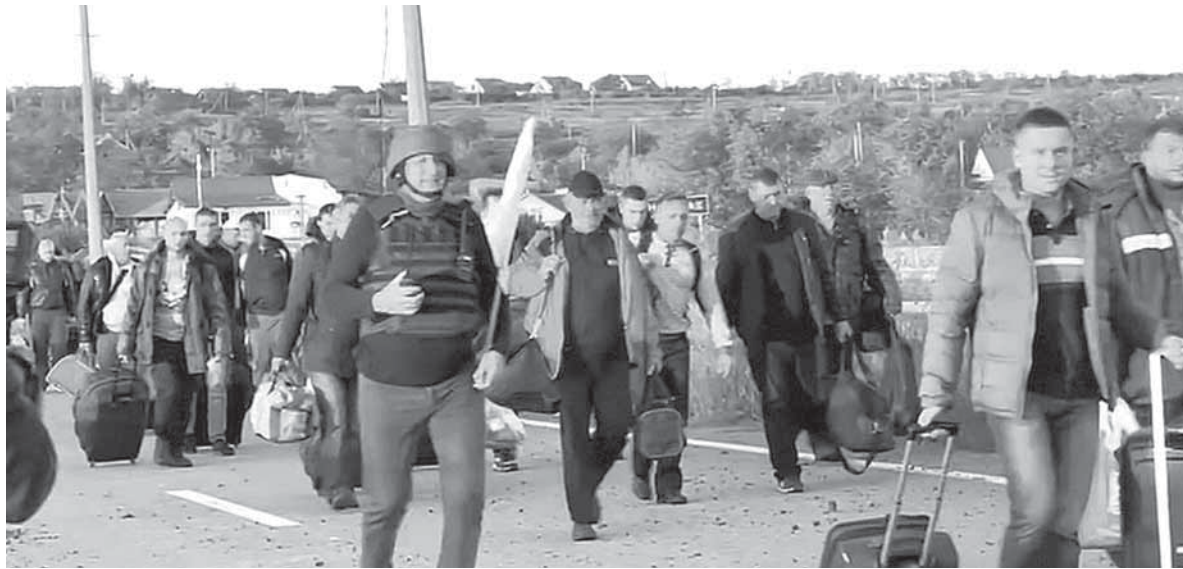
Процесс обмена пленными в Запорожской области

«Ребята подвергаются пыткам, издевательствам. Условия их содержания не соответствуют никаким международным конвенциям. Наша задача – вытаскивать абсолютно всех, поэтому будем предпринимать все зависящие от нас меры», – сказал Пушилин. Он подчеркнул, что всем вернувшимся домой пленным будет оказана необходимая