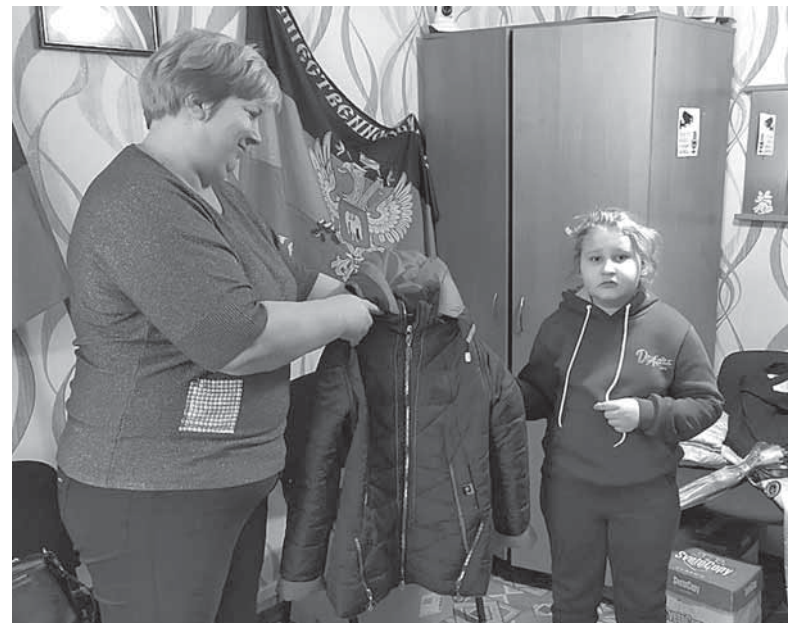
Теплые вещи для детей из Кировского