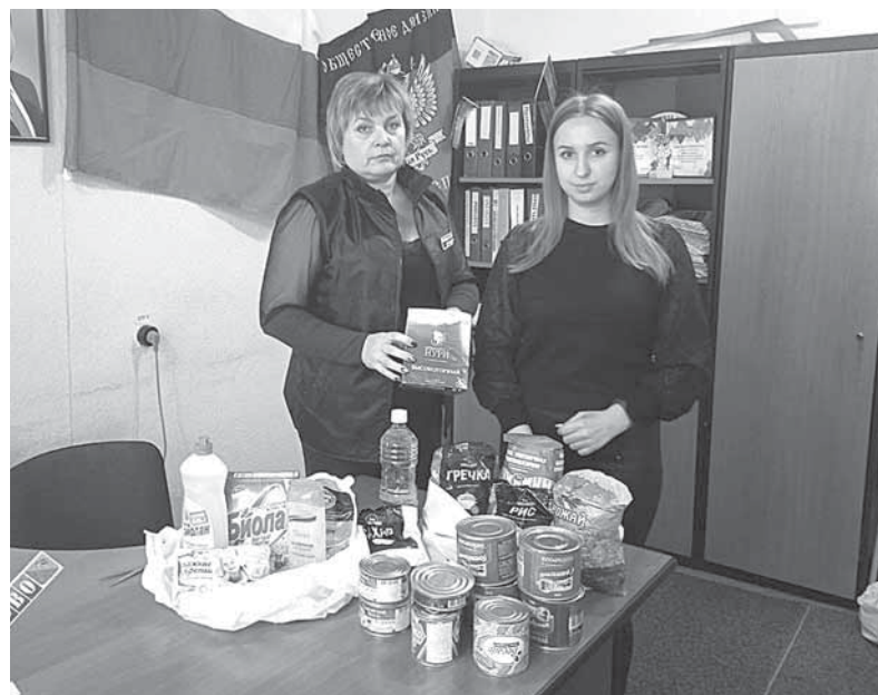
Гумнаборы для жителей Тельманово

Помимо этого, в Горловку для семей с маленькими детьми были доставлены 10 упаковок подгузников и 15 пачек детских смесей, закупленные при поддержке генерального директора группы