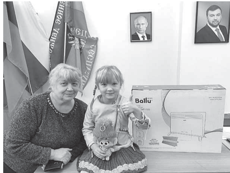
Новый обогреватель для семьи из Куйбышевского района

Помимо этого, представители Штаба по прифронту привезли