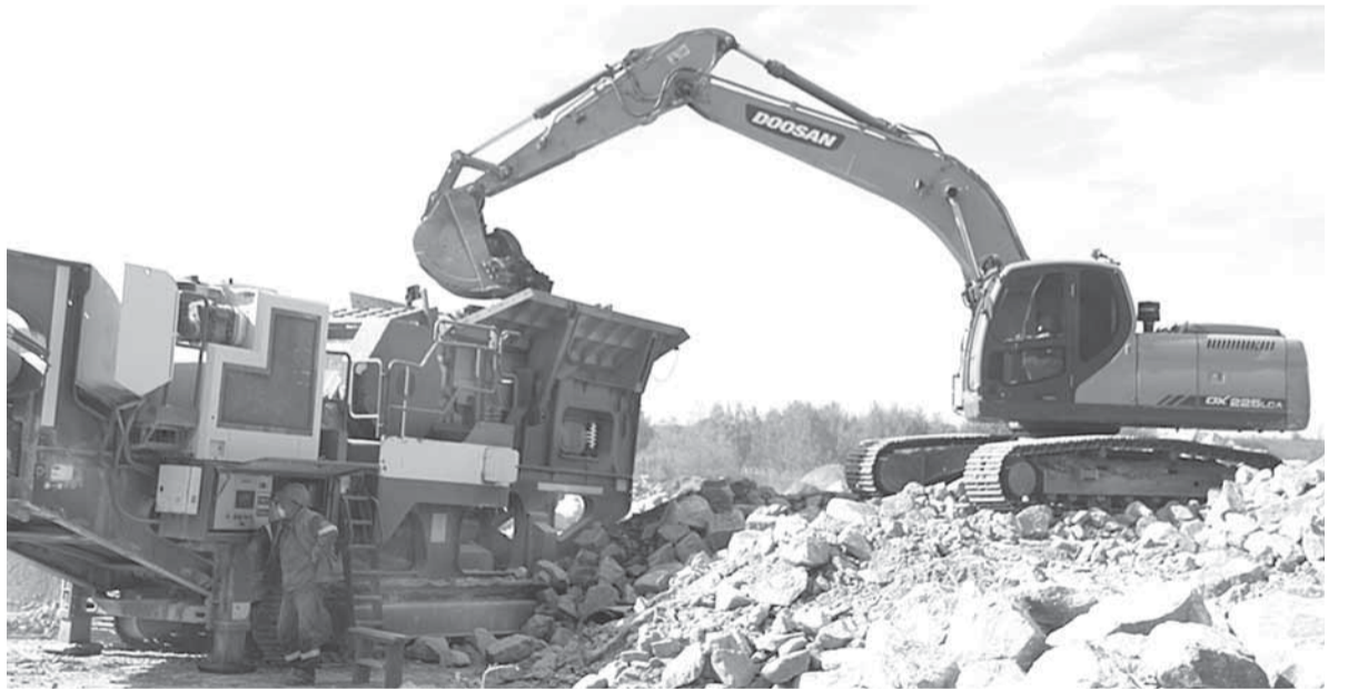
Техника на карьере работает круглосуточно

«Мы видим, что стройки предстоит много. Мы видим, что в каждом населенном пункте, который