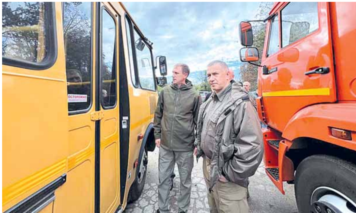
Спецтехника для ЖКХ Шахтерска

Помощь городу Кировское оказывает Республика Саха (Якутия). Ремонтно-восстановительные работы ведутся на 13 объектах социальной инфраструктуры, включая Дом культуры, больницу, четыре объекта ЖКХ и так далее. Идет ремонт средней школы № 2. Все работы планируется завершить до начала ноября. Для школы уже закуплена мебель, оборудование для актового зала и спортзала, учебная литература по стандартам РФ. В Кировском заверше-