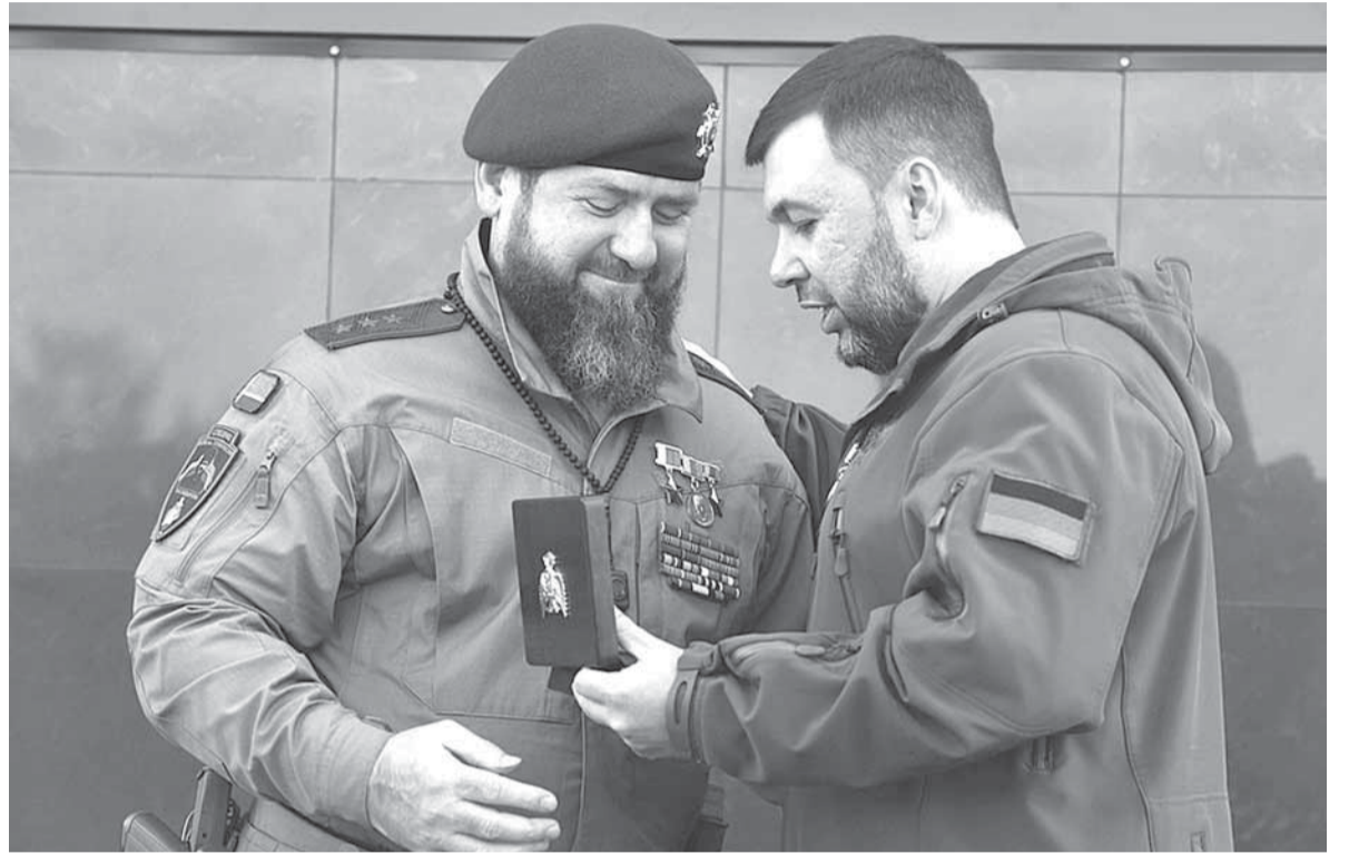
Рамзан Кадыров – Герой Донецкой Народной Республики

«Их стремление привести большую Россию к победе просто неизмеримо, – сказал врио Главы ДНР. – Мы приближаемся к победе совместными усилиями со всеми подразделениями, в том числе и с чеченскими братьями. Делаем все возможное, чтобы это произошло как можно быстрее.