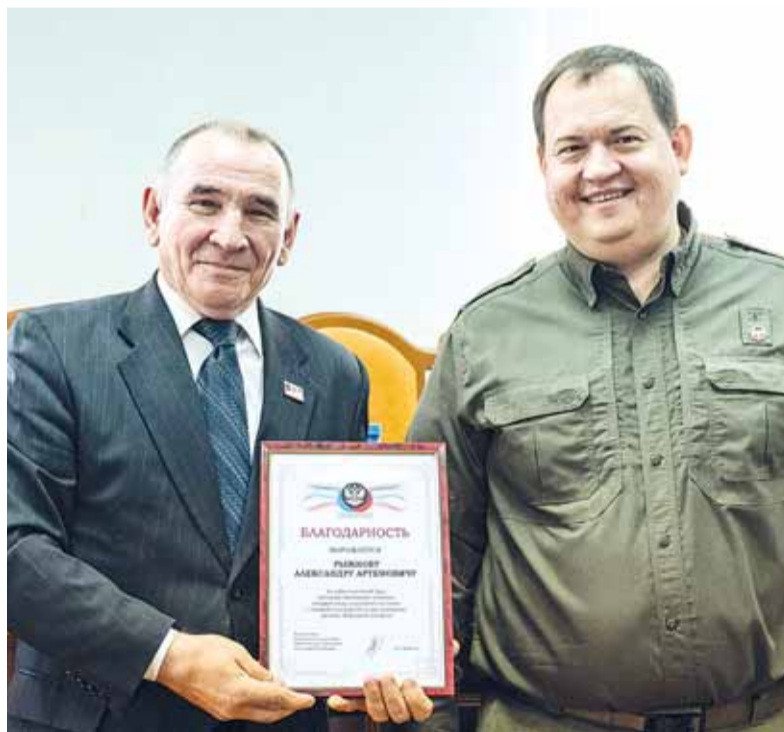
Заслуженная благодарность за работу

Также к активу Народного контроля обратился руководитель