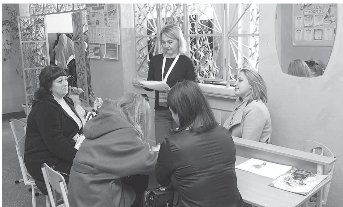
В пункте поддержки конкурсантов кипит работа

«Этот конкурс очень нужен на данный момент, потому что его целью является поиск, развитие, помощь людям, которые хотят восстанавливать нашу Донецкую Народную Республику», – сообщила она и отметила, что основной вопрос, который возникает у конкурсантов, – как писать эссе.