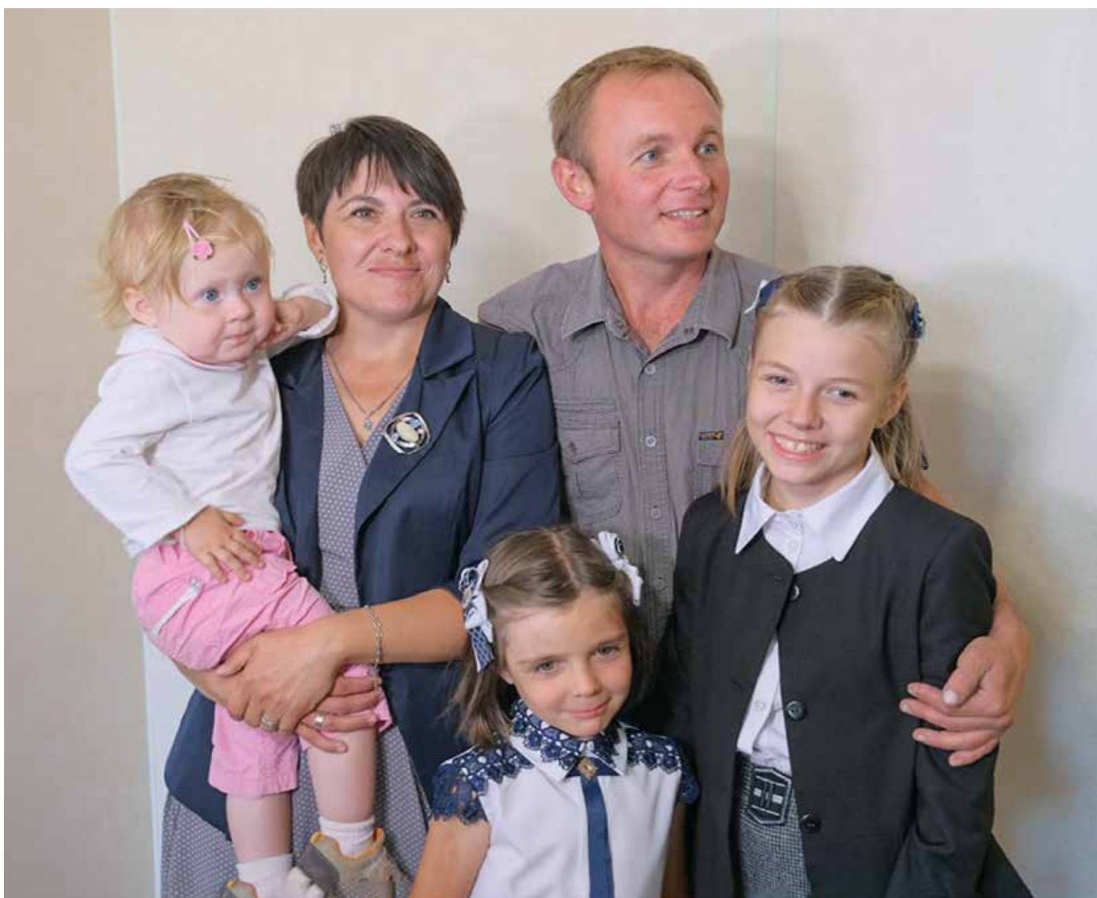
Многодетная семья получила новое жилье

«Работы вели в круглосуточном режиме. К рабо-