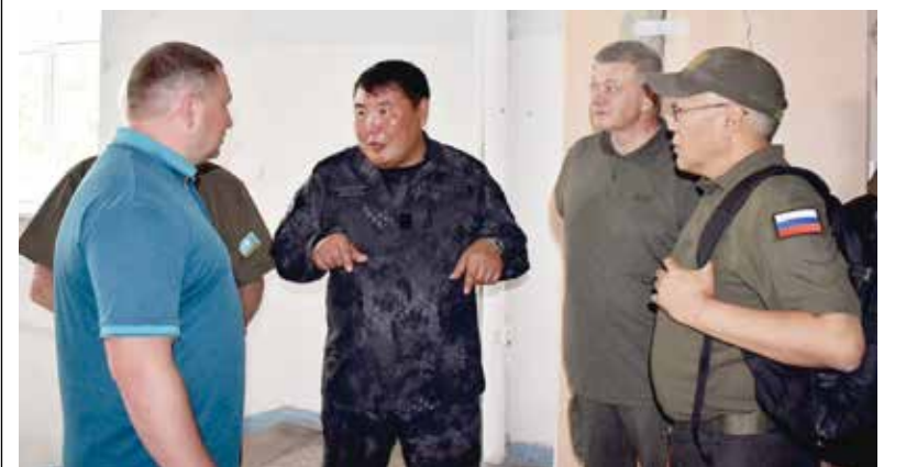
Депутаты Якутии проверили ход ремонтных работ