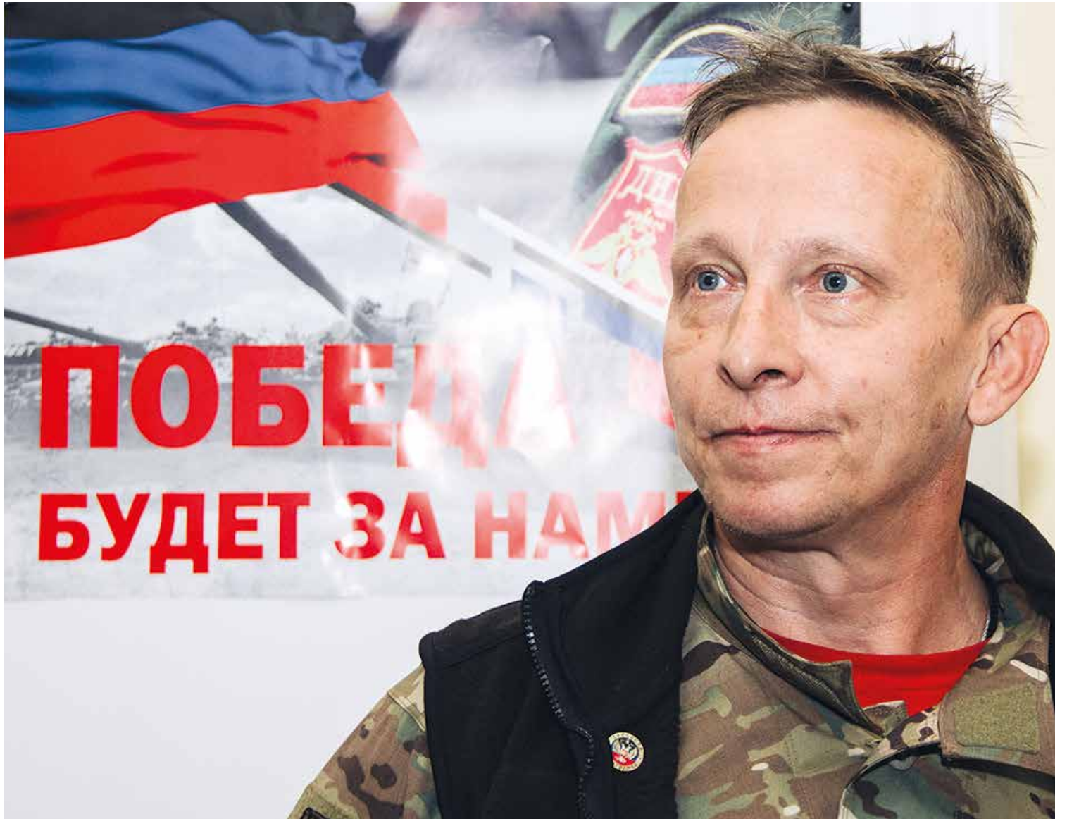
Иван Охлобыстин стал активистом ОД «ДР»

Говоря о подвиге жителей Донбасса, и не только тех, кто сражается на передовой, он отметил, что самое главное – это то, что это простые люди, разные, каждый со своими особенностями, но у каждого из них есть внутренний стержень. «Несмотря на все