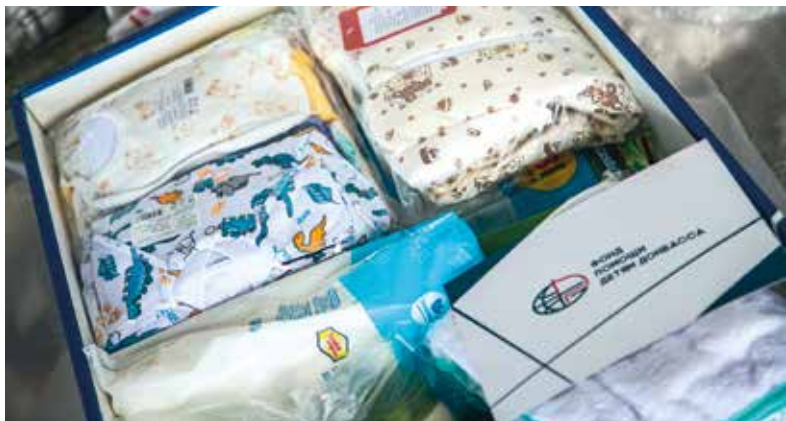
В гуманитарном наборе есть все необходимое

Общероссийский Народный фронт совместно с Благотворительным фондом помощи детям Донбасса передали в ДНР гуманитарную помощь для новорожденных детей в размере 2 250 наборов.