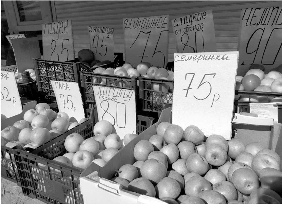
На рынки ДНР поступают фрукты из Херсона

«Нужно подкорректировать графики. Люди хорошо относятся к тому, что идет информирование в СМС-ках. Теперь бы информирование соответствовало фактическому состоянию дел. Давайте к этому этапу переходить», – сказал Денис Пушилин.