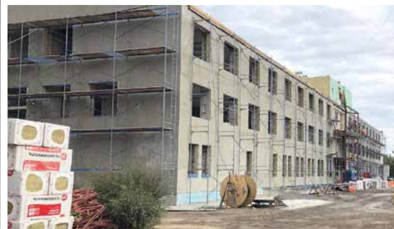
Больница скоро примет первых пациентов

Полностью завершить ремонтные работы российские подрядчики планируют до конца текущего года.