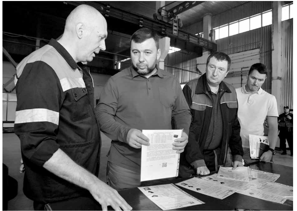
Денис Пушилин ознакомился с работой завода ООО «Инженерные сети»

На вопрос Дениса Пушилина «Что мешает сейчас выстро-