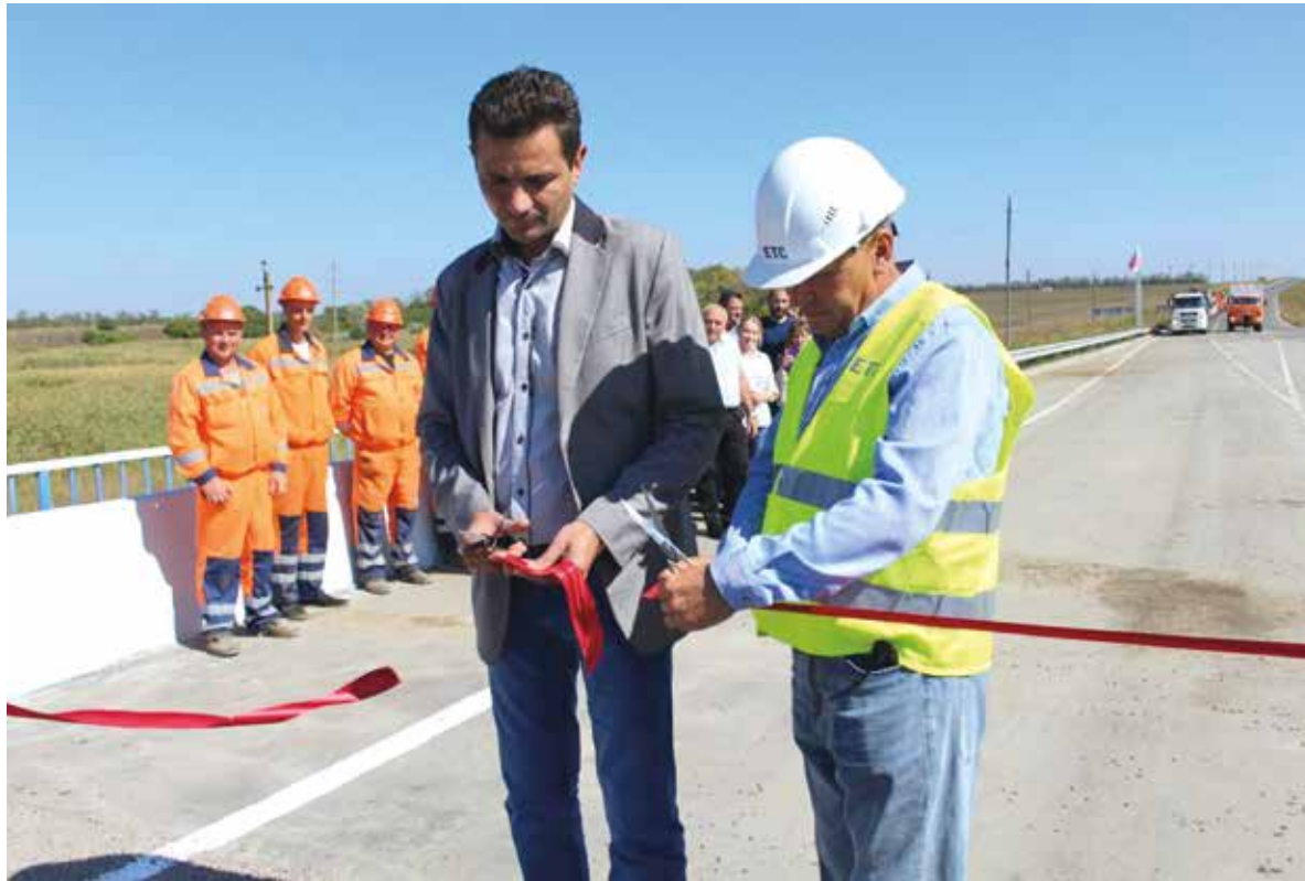
Открытие моста в селе Камышеватое

Во время ремонта российские подрядчики демонтировали разрушенные конструкции моста, обустроили новые стойки опоры и ригеля, соорудили опорные площадки, смонтировали опор-