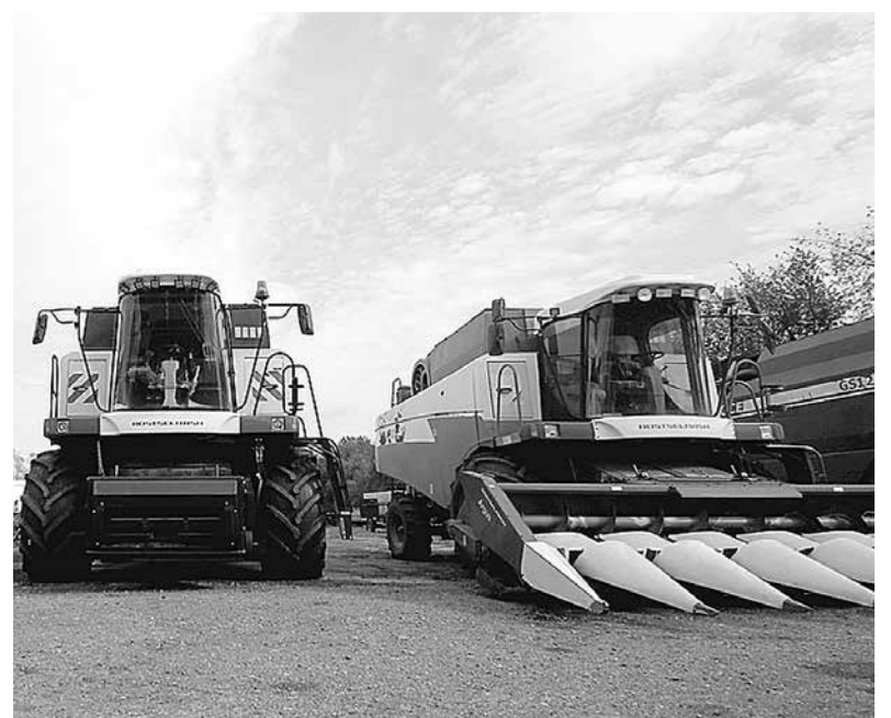
Лизинговая техника для сбора урожая

В ходе встречи сельхозпроизводители задали Главе ДНР волнующие их вопросы. Они касались реализации зерна, обеспечения ГСМ, запретительных действий органов власти на местном уровне, развития территорий, нотариального оформления наследственных прав на объекты недви-