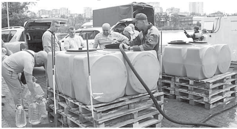
Одна из станций очистки воды в Донецке

В понедельник, 5 сентября, по поручению Главы ДНР Дениса Пушилина состоялся брифинг по проблемам водоснабжения в Республике.