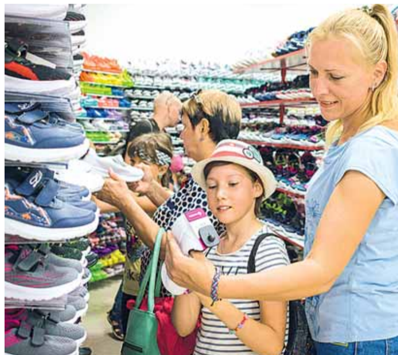
Обувь и одежда на любой вкус

«Сертификаты получили семьи из Донецка, Горловки, Ясиноватой и Мариуполя. Перед вручением сертификатов дети и родители разрисовали баннер «Хочу в Россию». Впечатлений и эмоций у ребят было очень много. Теперь у каждого, кто получил