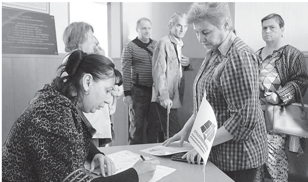
Прием специалистов «Правомобили» в Бугасе

«В основном обращались с вопросом перерасчета, возобновле-