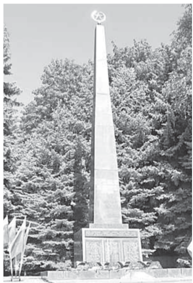
В Шахтерске и Торезе почтили память воинов-освободителей