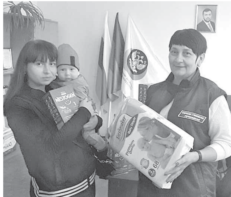
Помощь жителям прифронта от Екатеринбурга

Во вторник, 6 сентября, активисты доставили гуманитарную помощь семьям с маленькими детьми Дебальцево и Петровского района Донецка. Как рассказал начальник Штаба по при-