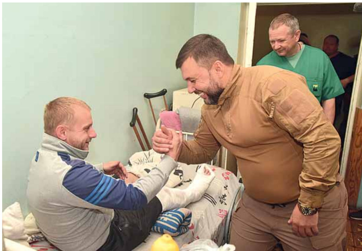
Денис Пушилин пожелал бойцам скорейшего выздоровления

Денис Пушилин поручил руководству больницы подготовить списки бойцов, которые идут на поправку, чтобы отправить их на реабилитацию в Российскую Федерацию.