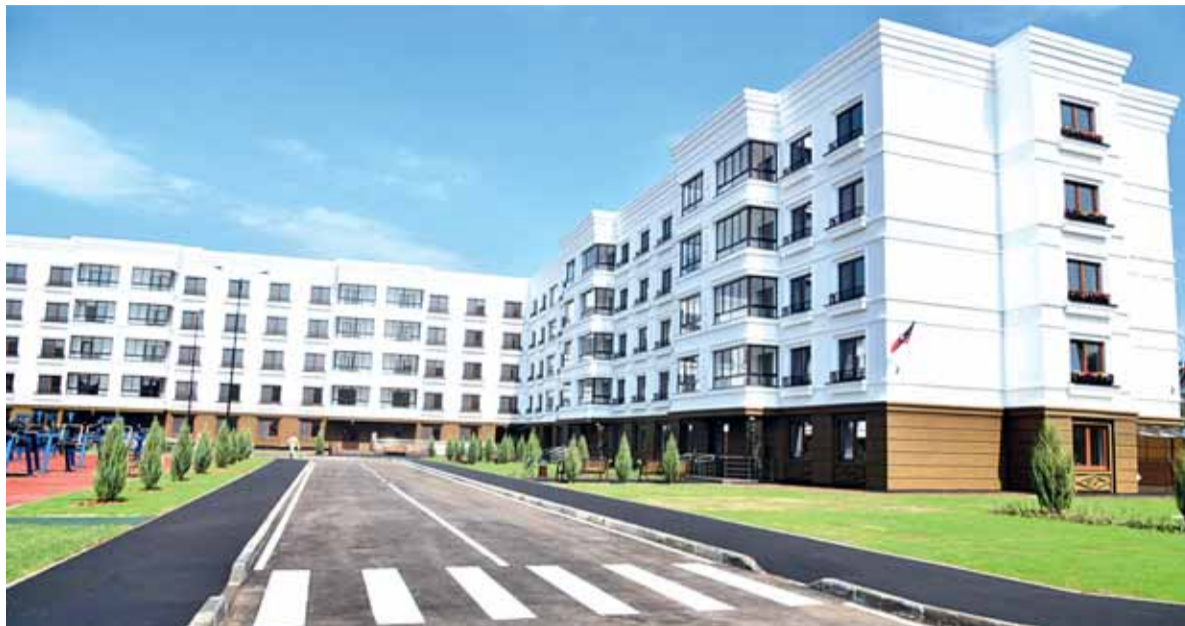
Новый многоквартирный дом готов к сдаче

«Мы были на всех этапах строительства, начиная с того, когда это еще был просто пустырь, когда только выбирали площадку. Не верилось. Но сейчас мы видим своими глазами, что Военно-строительная компания справилась не просто на 100%, а на 150 с учетом того, что Мариуполь полностью разрушен, уничтожен неонацистами. Мы видим новый современный, современнейший я бы сказал, микрорай-