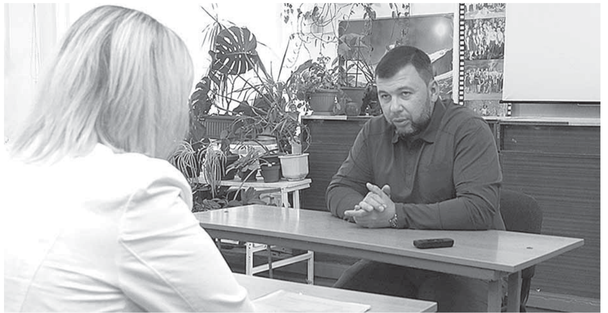
Глава ДНР Денис Пушилин обсудил текущие вопросы с педагогами

По словам главы государства, дистанционная форма обучения не может заменить очную. «Дистанционное обучение может быть до-