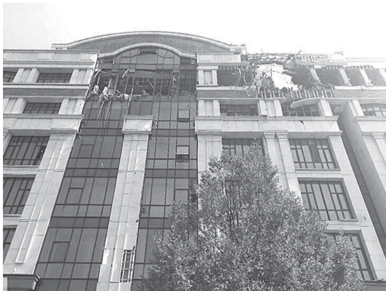
Поврежденное здание Администрации Главы ДНР

Согласно выводам экспертов Совместного центра контроля и координации, в первые две серии атак по Ворошиловскому району противник использовал артиллерий-