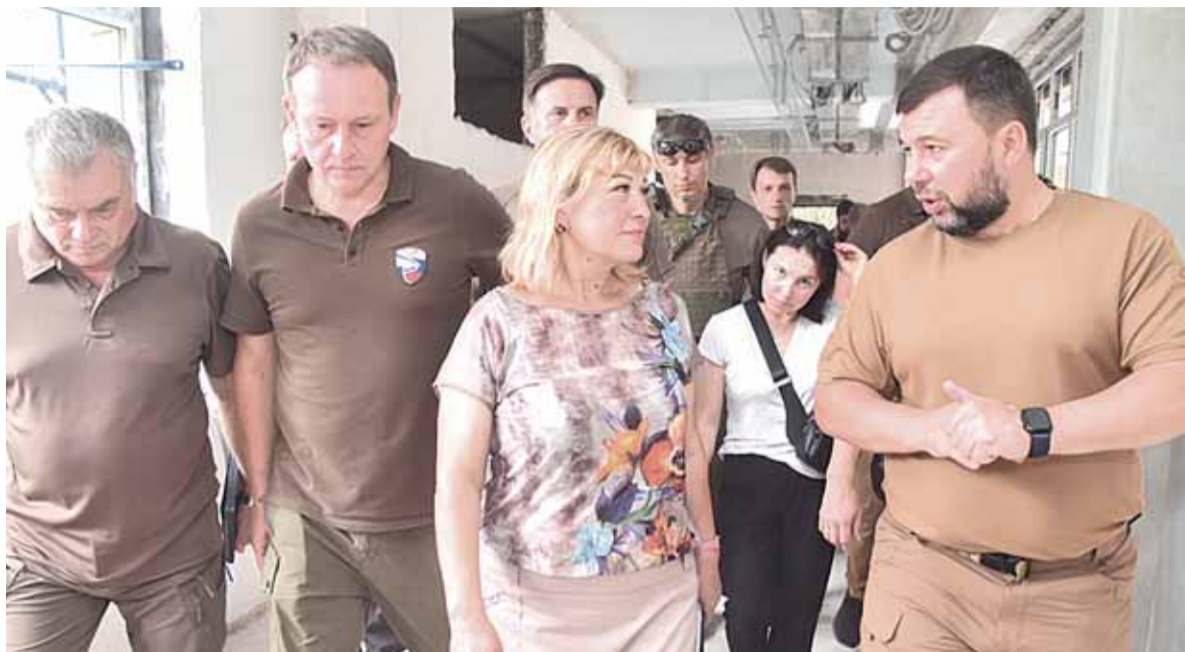
Школа № 65 к 1 сентября практически готова

«Были устранены все повреждения, вызванные прилетами, полностью заменены все инженерные системы внутри, заменены все оконные конструкции, утеплен фасад, выполнены все работы внутренние отделочные для того, чтобы шко-