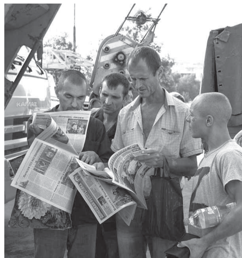
Рабочие читают «Донецкую Республику»

По его словам, на собрании также было много вопросов по восстановлению жилья и коммуникаций, социальных выплат и оформления гражданства Российской Федерации. Он также сообщил, что был избран ак-