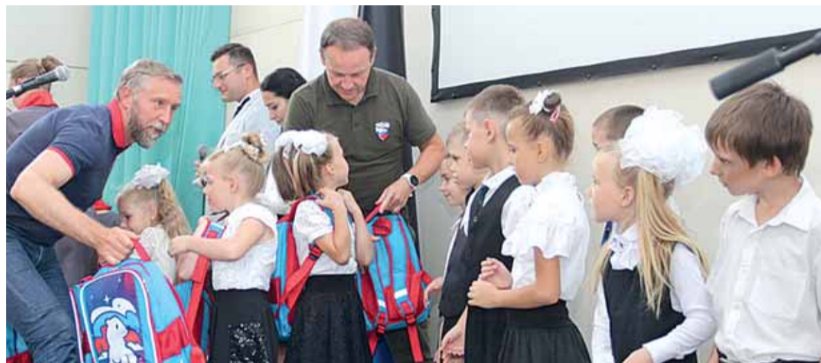
В первый класс – с новыми рюкзаками

Учебные заведения, расположенные на освобожденных территориях Донецкой Народной Республики, переходят на российские образовательные стандарты. Об этом в пятницу, 19 августа, заявил Глава ДНР Денис Пушилин на пленарном заседании Августовских педагогических студий на тему «Учить, воспитывать, создавать вместе».