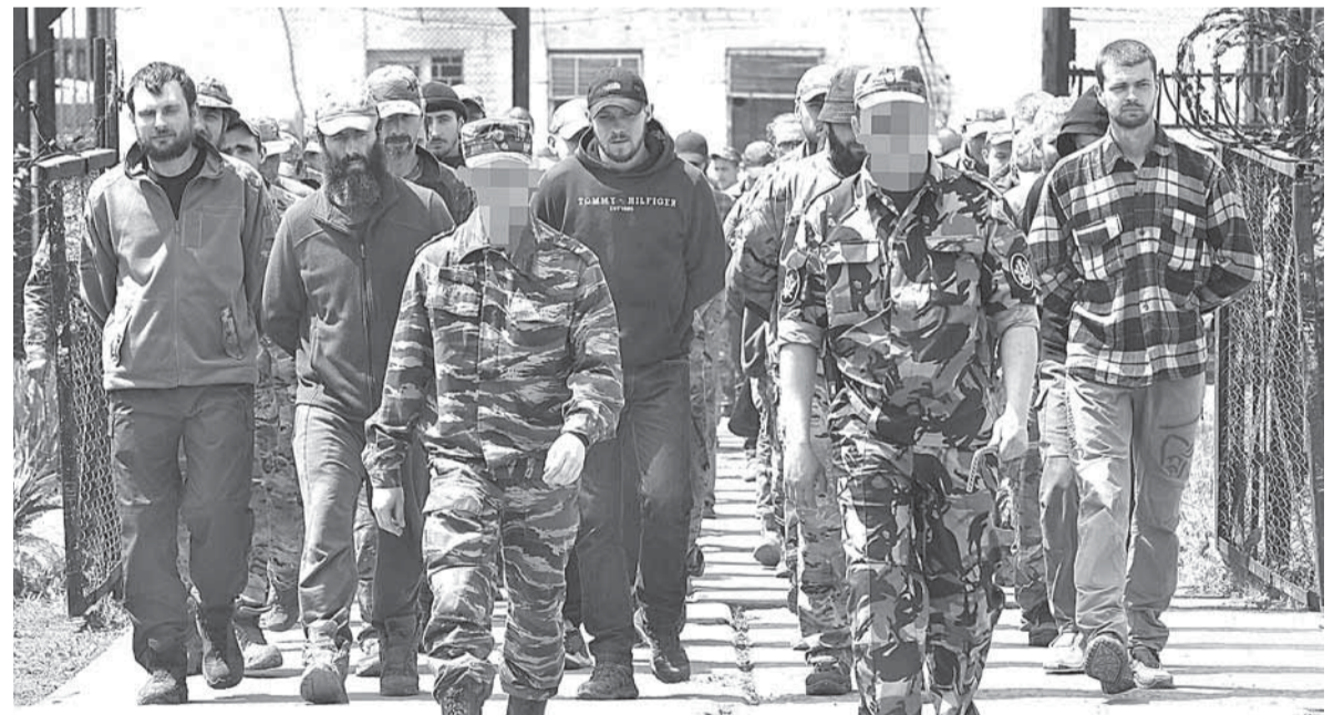
Перед трибуналом предстанут все военные преступники

Украинских военных преступников ждет неминуемый трибунал, уверен лидер страны.