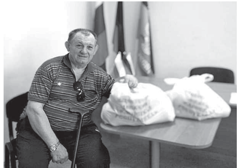
Гуманитарная помощь жителю Ленинского района