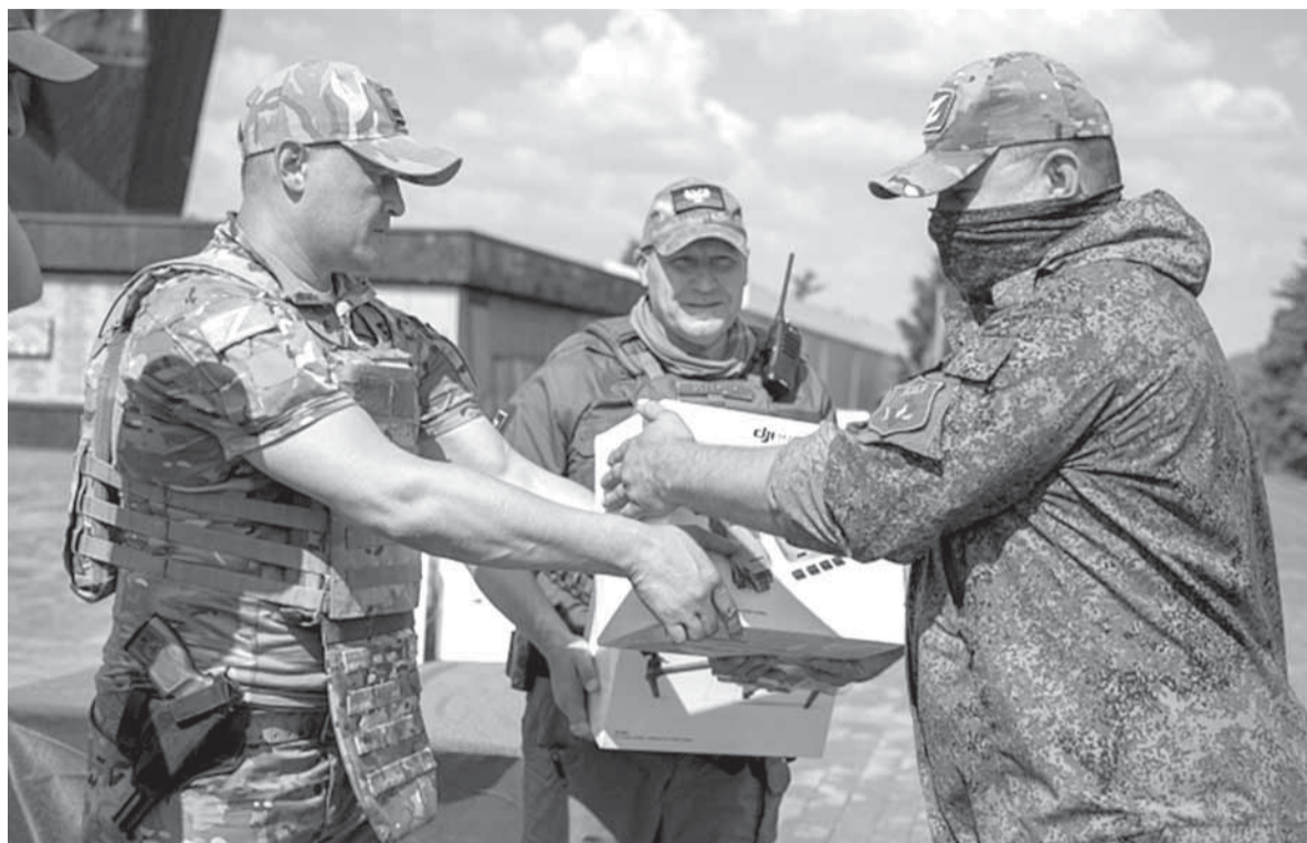
Бойцы НМ ДНР готовы эффективно использовать беспилотники