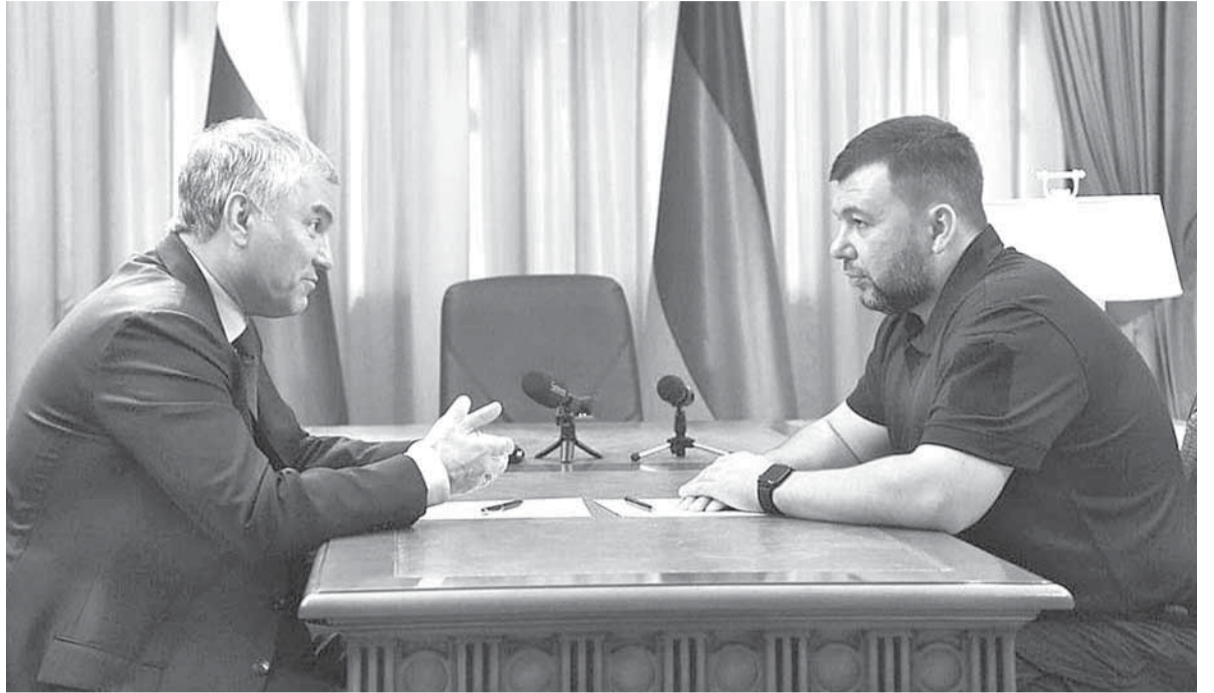
Встреча Председателя Госдумы РФ и Главы ДНР прошла конструктивно

«Активизировалась совместная работа, направленная на гармонизацию республиканского за-